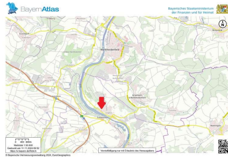
Umgebungskarte: © Bayerische Vermessungsverwaltung