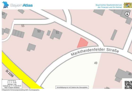
Lageplan: © Bayerische Vermessungsverwaltung