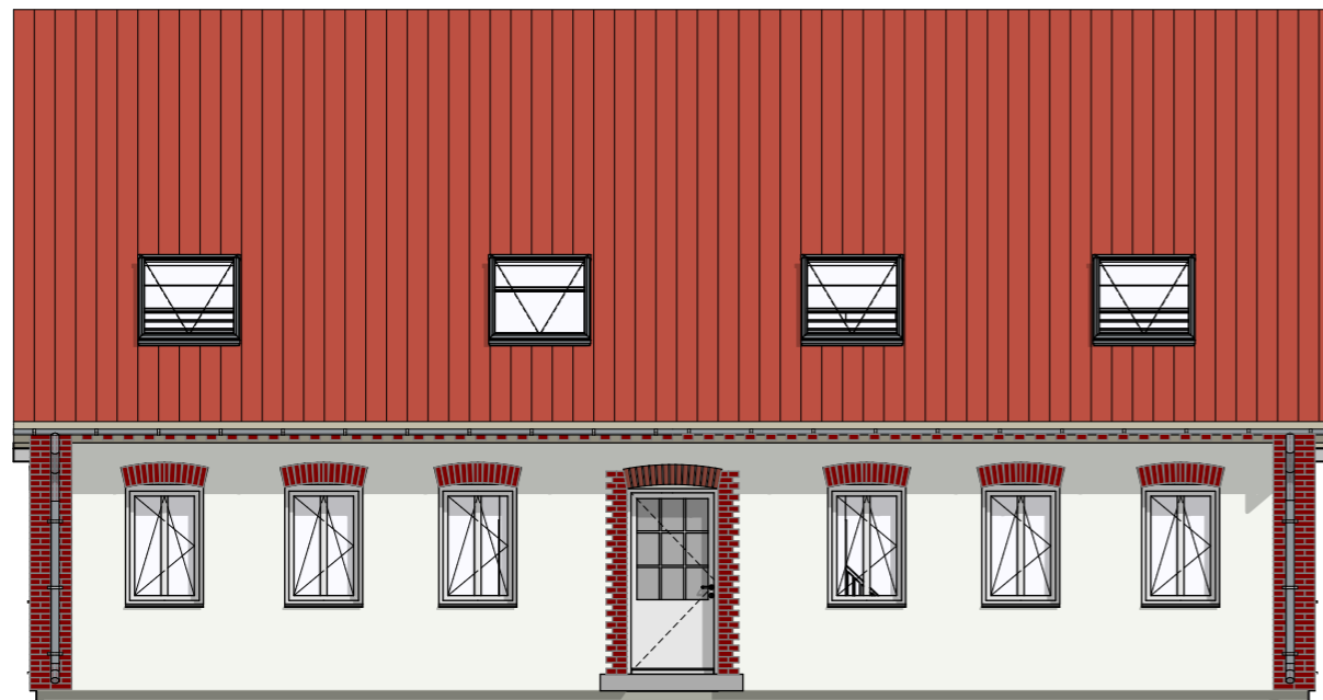
A-04 Ansicht West 1:100