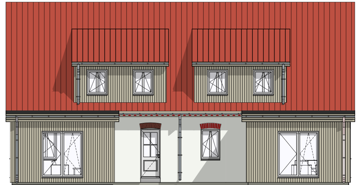
A-02 Ansicht Ost 1:100