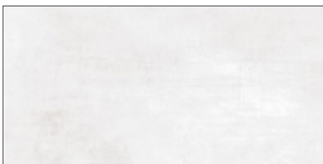
WANDFLIESE (46) Vitra, Metro, weiß matt 60 cm x 30 cm