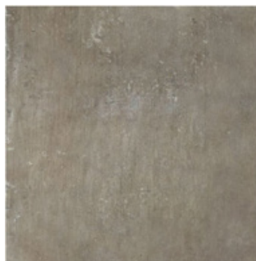
BODENFLIESE (82) PiaCera, Unika, brown matt Betonoptik 60 cm x 60 cm