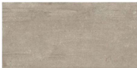
BODENFLIESE (34) Castelvetro, Ubahn, graubraun 60 cm x 30 cm