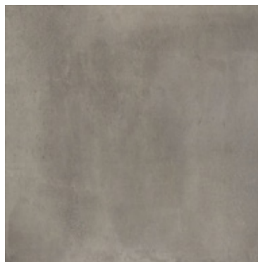
BODENFLIESE (208) Castelvetro, Fusion, Piombo 60 cm x 60 cm