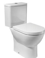
o similar / or similar Inodoro Toilet