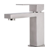
o similar / or similar Grifería Faucets