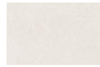
o similar / or similar Hormigón desactivado Deactivated concrete