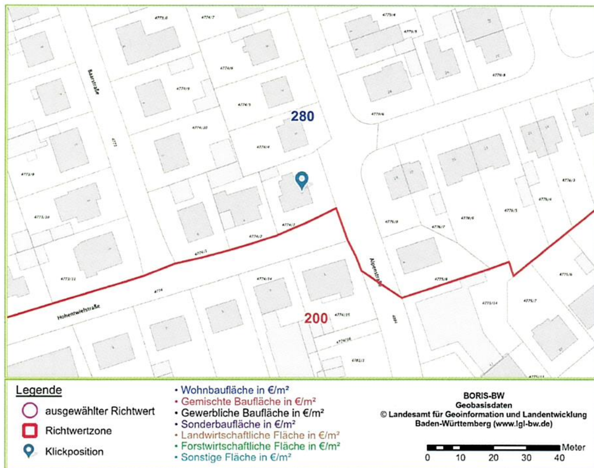
Abbildung 2: zentralisierte Darstellung der Klickposition mit den gewählten Einstellungen von Maßstab und Hintergrundkarte am Bildschirm

Der von Ihnen gewählte Bereich liegt in der Gemeinde/Stadt Villingen-Schwenningen. Die Darstellung dieses Kartenbereichs kann durch den Anwender individuell beeinflusst werden, z.B. durch Ändern der Klickposition, des Zoommaßstabs oder der Auswahl der Hintergrundkarte.