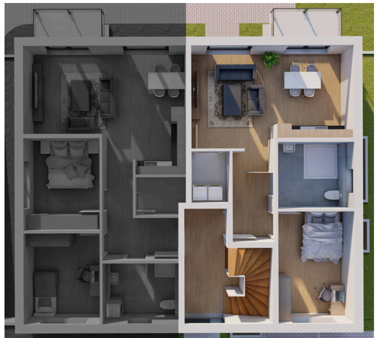
Erdgeschoss Wohnung Nummer 3