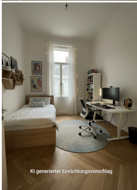
KI generierter Einrichtungsvorschlag