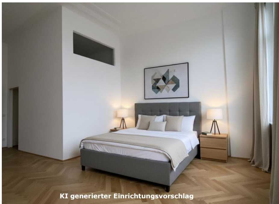
KI generierter Einrichtungsvorschlag