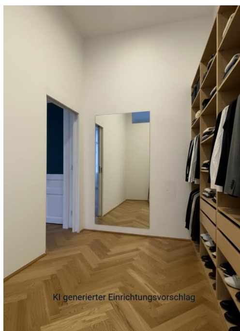
KI generierter Einrichtungsvorschlag