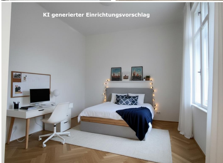
KI generierter Einrichtungsvorschlag