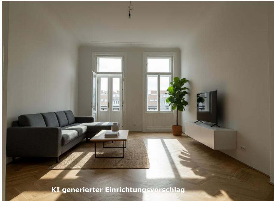
KI generierter Einrichtungsvorschlag

Ziehrerplatz 7 Top 9, 1030 Wien, ca. 155,18m 2 , 4 Zimmer