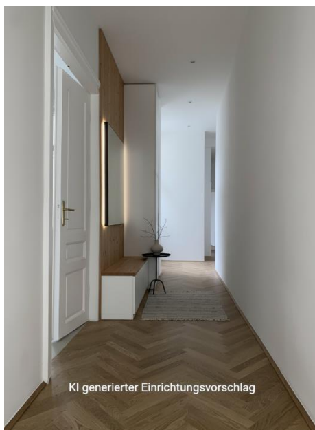
KI generierter Einrichtungsvorschlag