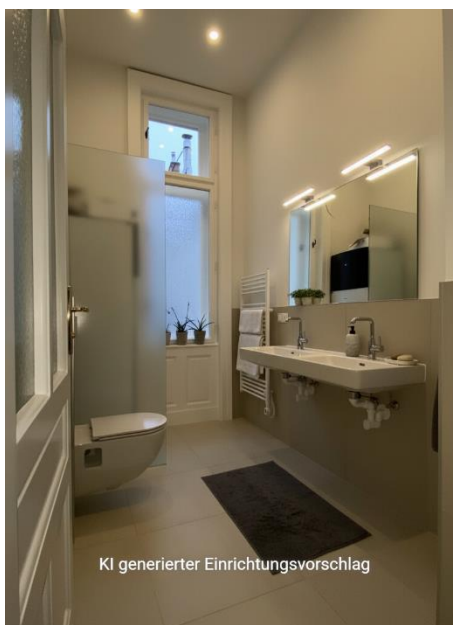
KI generierter Einrichtungsvorschlag