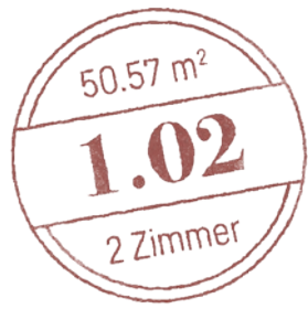
Haupthaus · Hochparterre