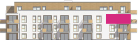
Haus A - Ansicht Süd