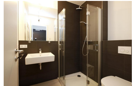
Bad mit Dusche