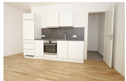
Küche & Abstellraum