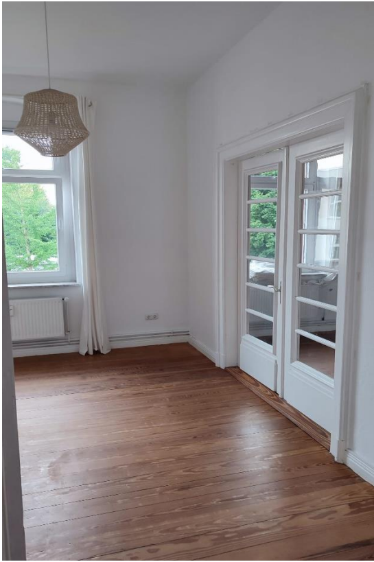
Raum 3 Ansicht a