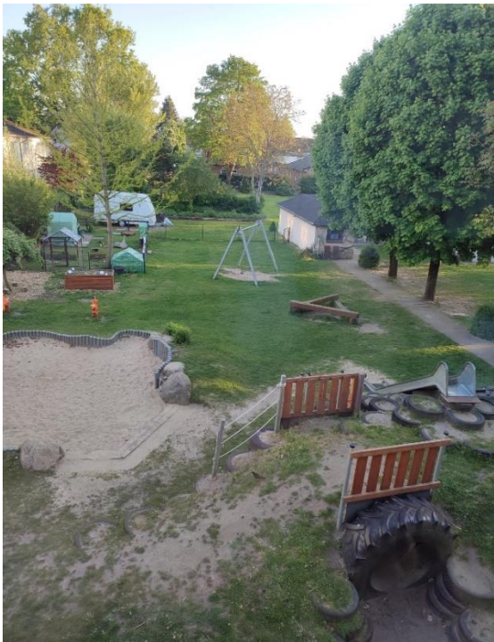
Ausblick auf das Gemeindegrundstück