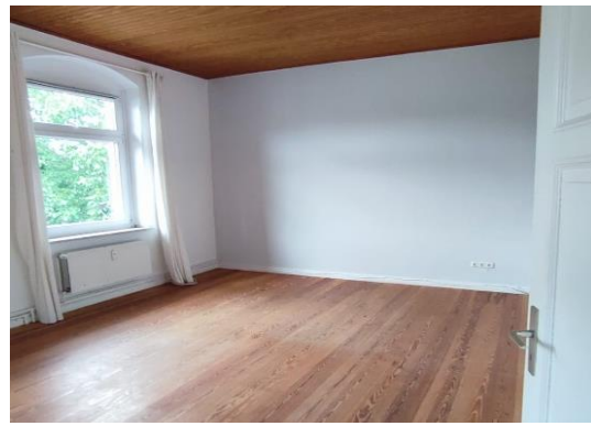
Raum 2 Ansicht b