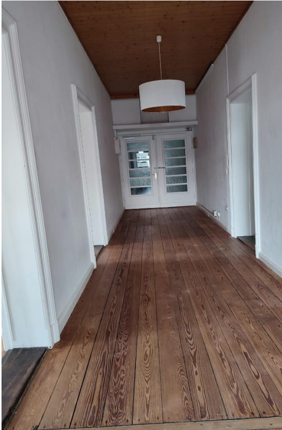
Wohnungsflur, Ansicht a