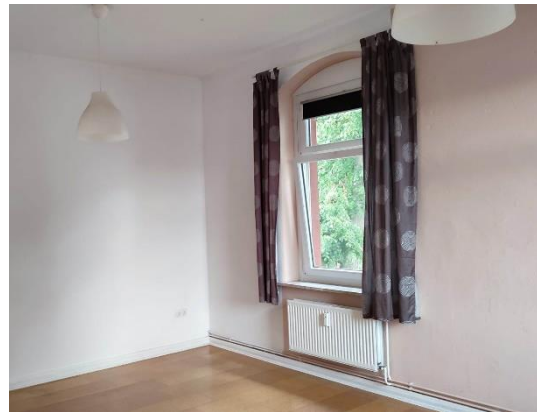
Raum 1 Ansicht b