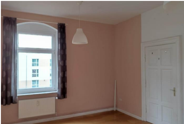
Raum 1 Ansicht a