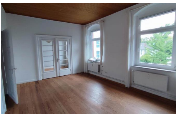
Raum 2 Ansicht a