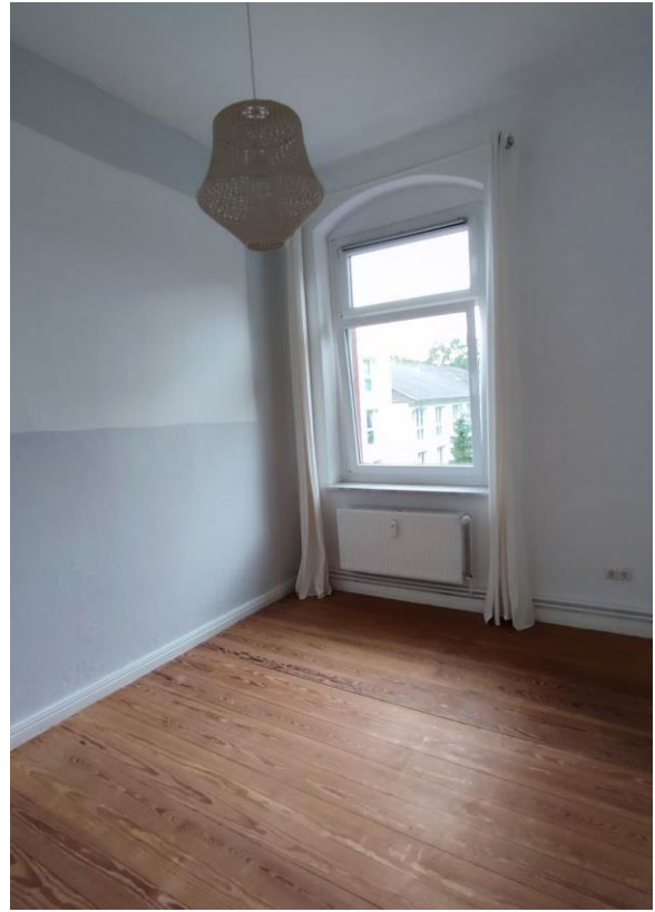
Raum 3 Ansicht b