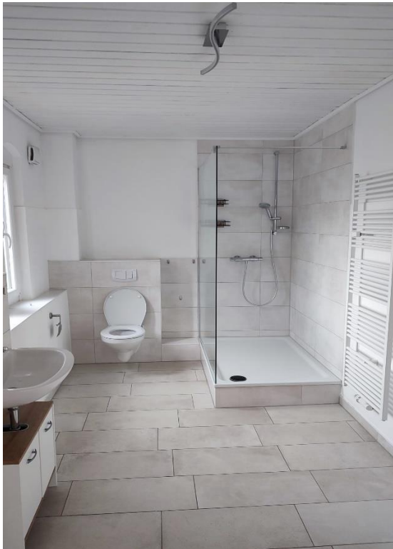
Bad und WC