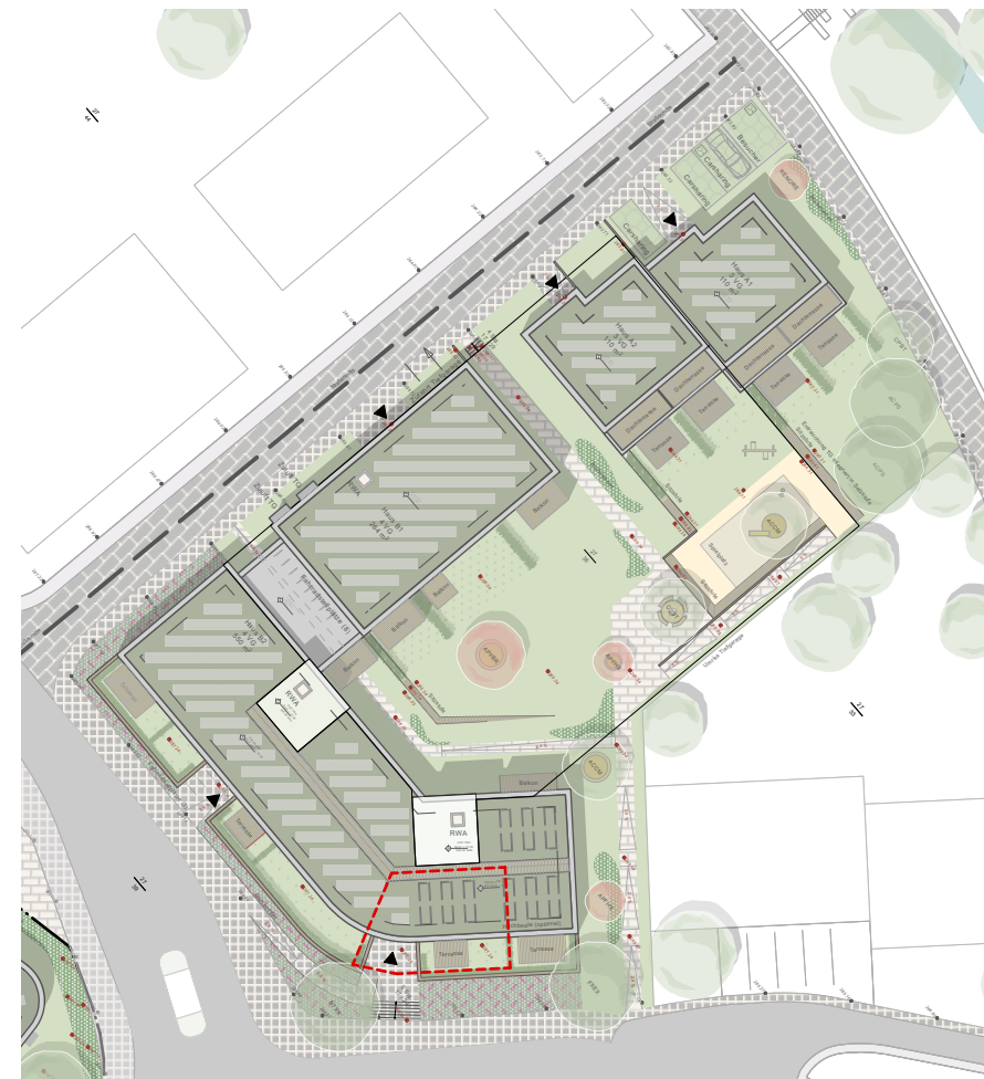
Dr.-Walter-Lübcke Straße > Lage der Wohnung