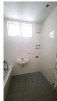
Bad mit Tageslicht und Wanne

Zur Wohnung gehört ebenfalls ein Kellerabteil.