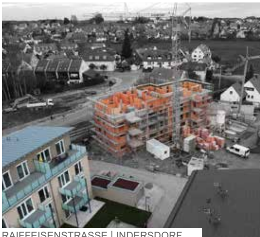
RAIFFEISENSTRASSE | INDERSDORF