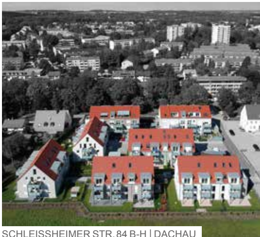
SCHLEISSHEIMER STR. 84 B-H | DACHAU