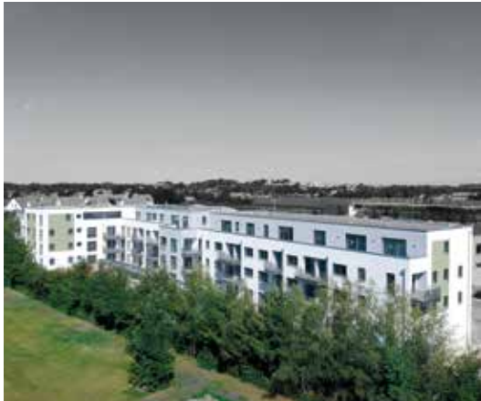
GESCHWISTER-SCHOLL-STRASSE 9,11 & 13 | DACHAU