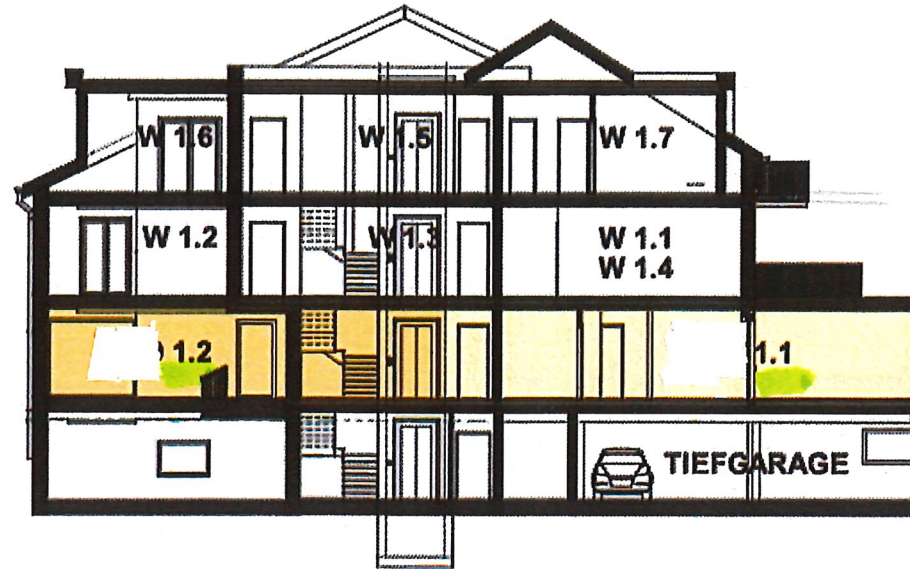
ÜBERSICHTSPAN SCHNITT "GEBÄUDE 1"