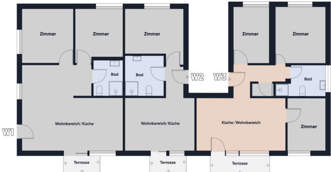
Grundrissplan ohne Maßstab EG