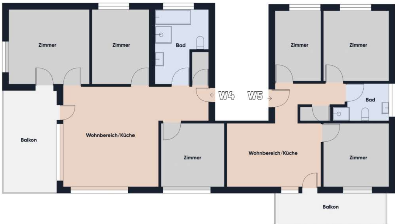
Grundrissplan ohne Maßstab OG