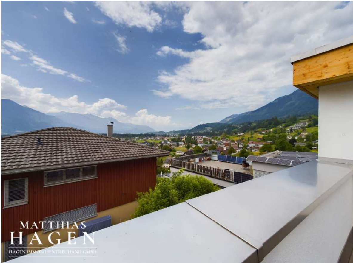
Ausblick Terrasse W4