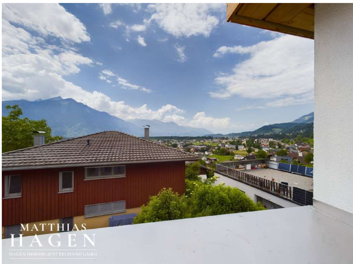
Ausblick Terrasse W4-1