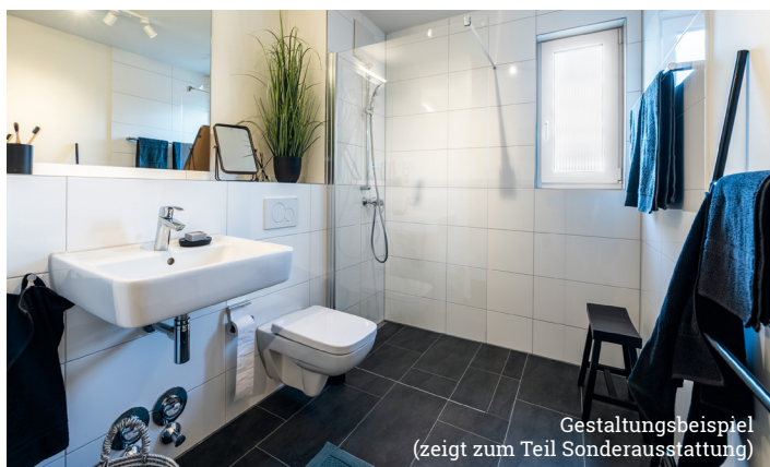
Gestaltungsbeispiel (zeigt zum Teil Sonderausstattung)

Innerhalb der Wohnung werden batteriebetriebene Rauchwarnmelder gemäß den gesetzlichen Bestimmungen installiert. Die Lieferung und Montage der Rauchmelder erfolgt auf Leasing- bzw. Mietbasis.