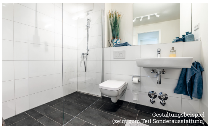
Gestaltungsbeispiel (zeigt zum Teil Sonderausstattung)