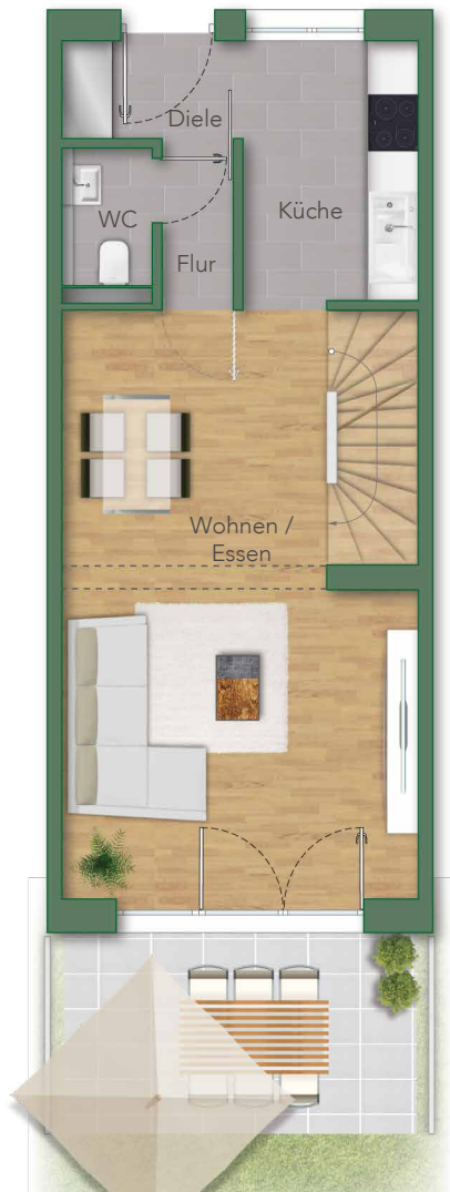
— EG —