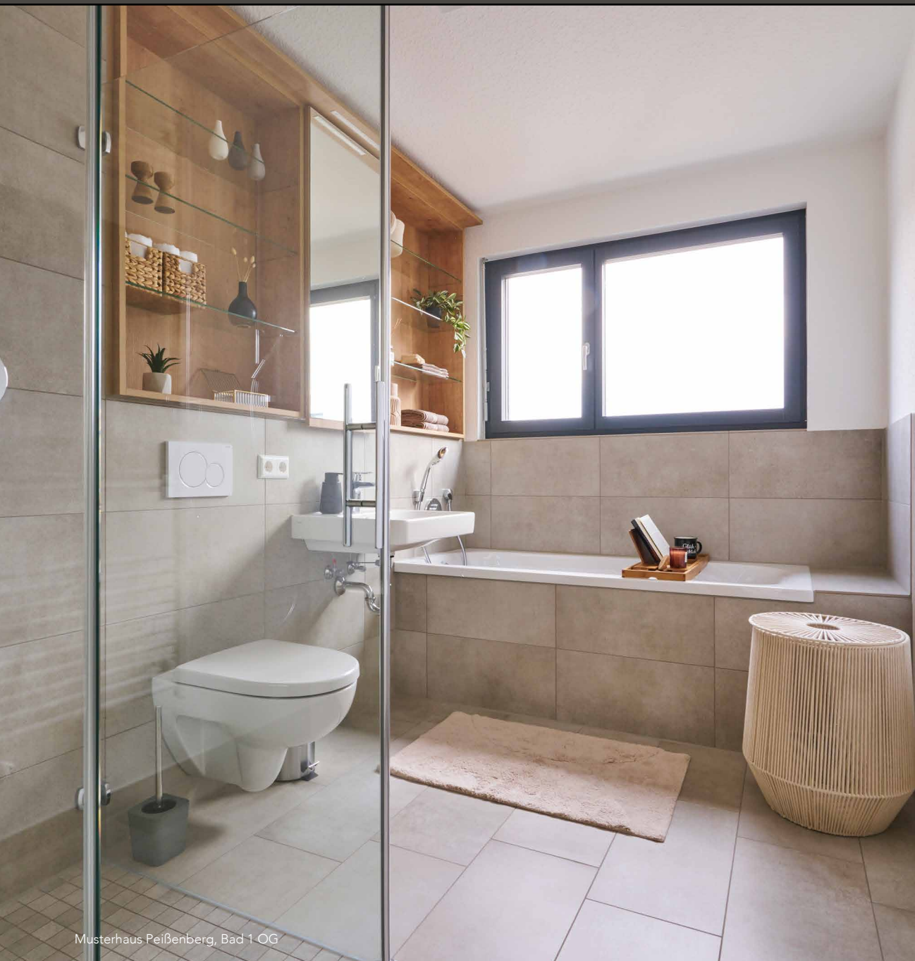
Musterhaus Peißenberg, Bad 1 OG