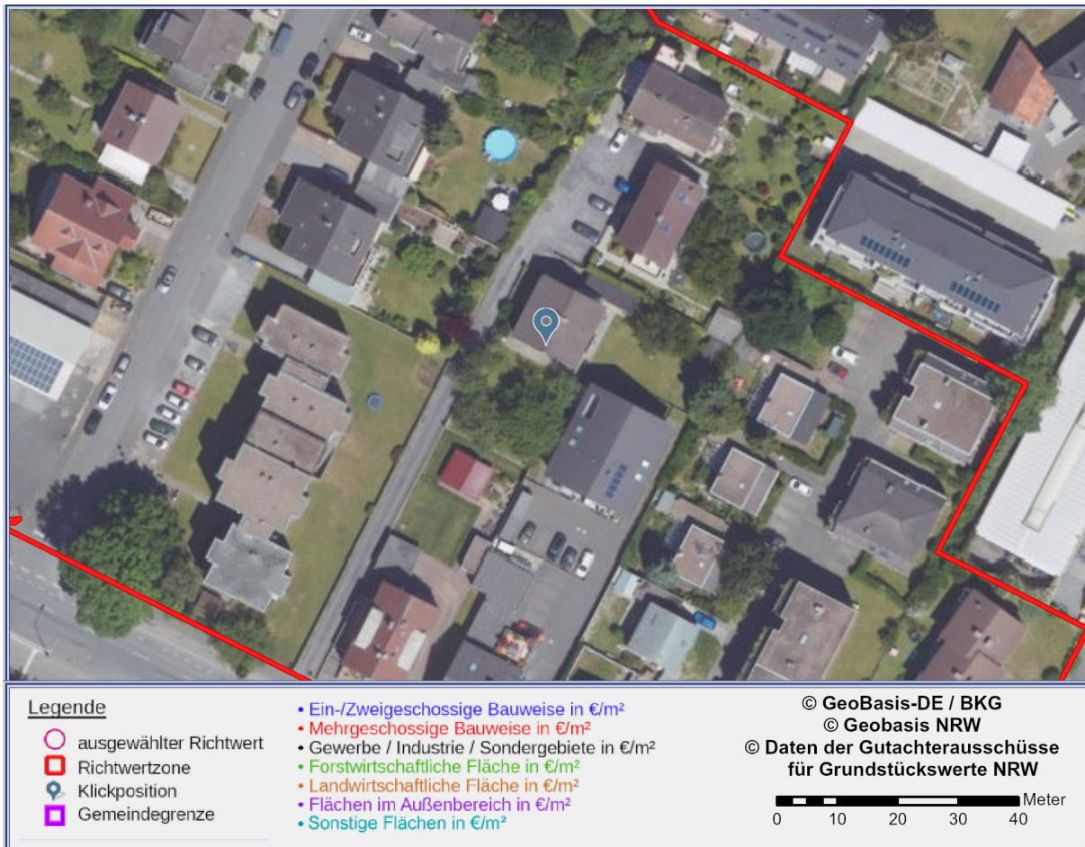
Abbildung 2: Detailkarte gemäß gewählter Ansicht