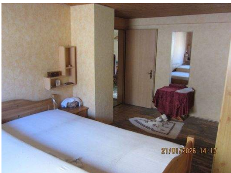
OG ZIMMER 2a.JPG