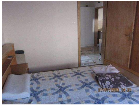
OG Zimmer 3b.JPG