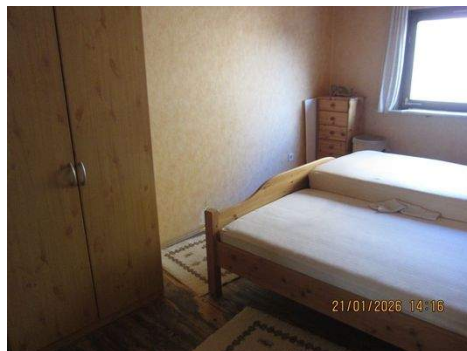
OG, immer 2b.JPG