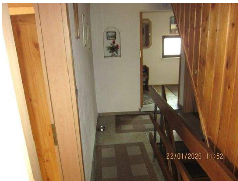
OG, Gang 1b.JPG