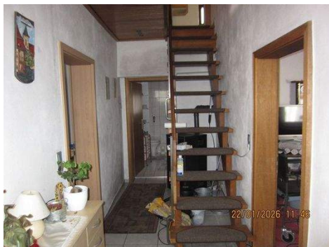
EG, Gang 1b.JPG