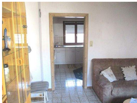
OG Zimmer 5b.JPG