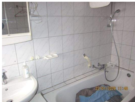
EG, Bad-WC 1a.JPG