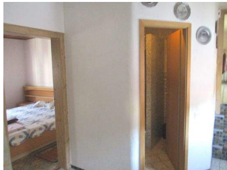
OG Zugang Dusche-WC, Zimmer 3.JPG