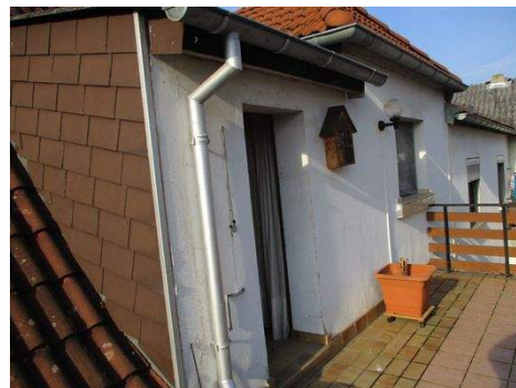
OG - Balkon.JPG