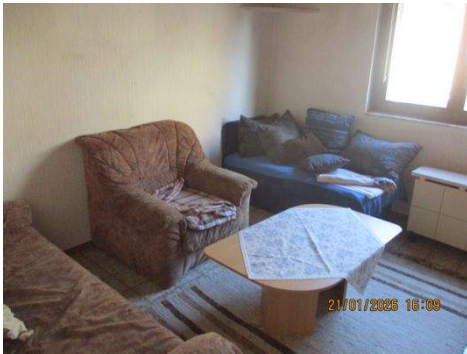
OG Zimmer 5c