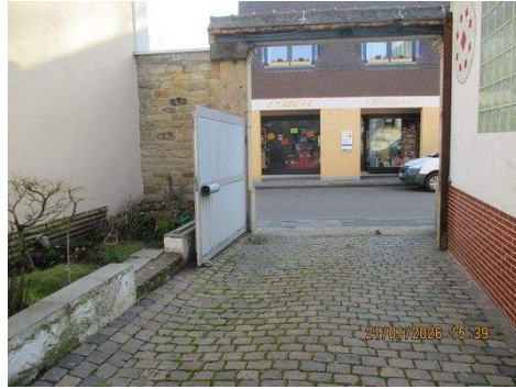
Hof zur Strasse.JPG