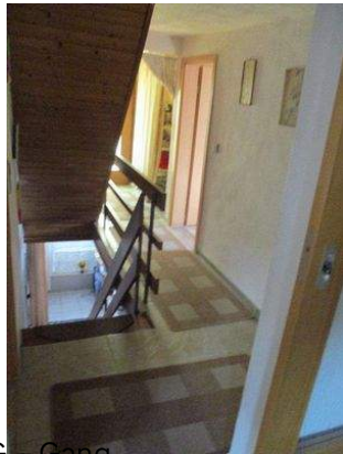
OG - Gang 1c.JPG