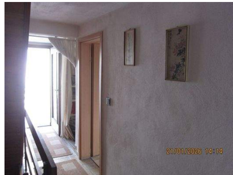
OG Gang 1a.JPG