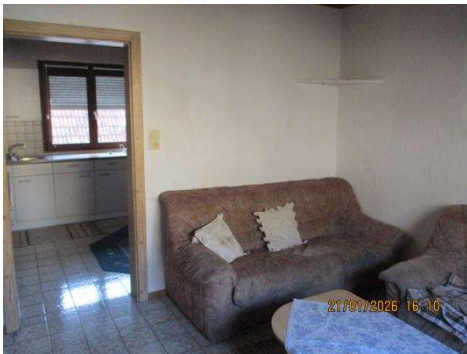
OG Zimmer 5e