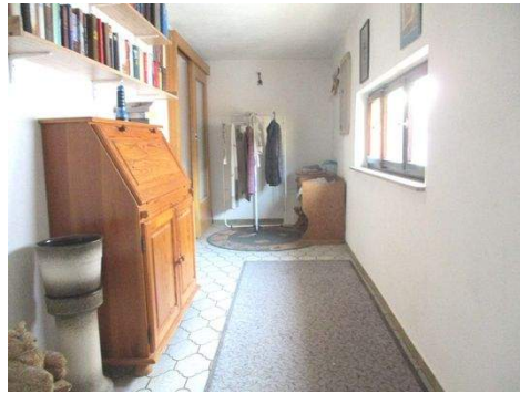
OG Gang 2.JPG