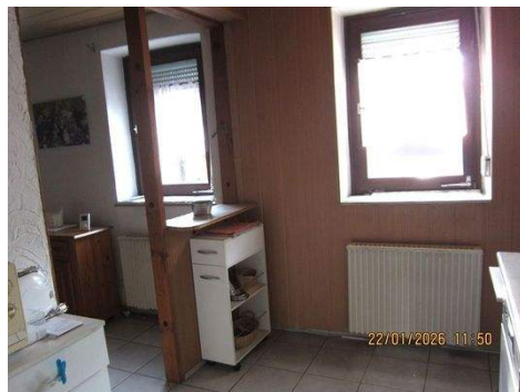
EG Küche 1b.JPG