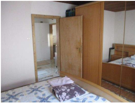
OG Zimmer 3a.JPG