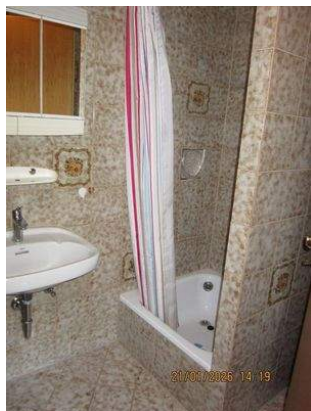
OG Dusche- WC.JPG