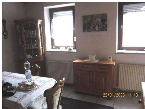
EG Esszimmer 1a.JPG