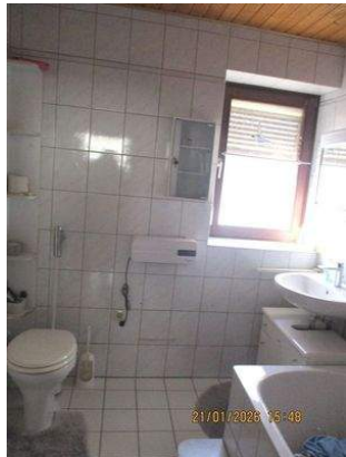
EG Bad-WC 1b.JPG