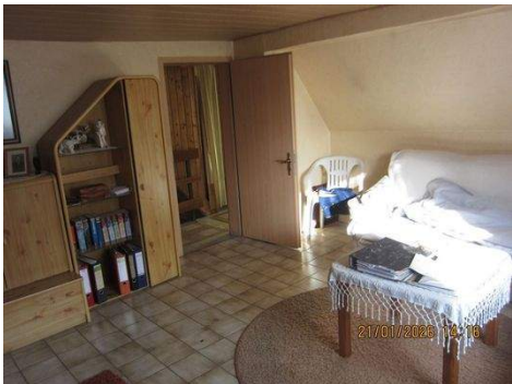
OG, Zimmer 1b.JPG