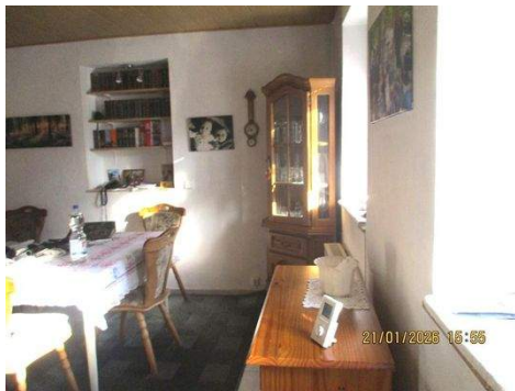
EG, Esszimmer 1b.JPG