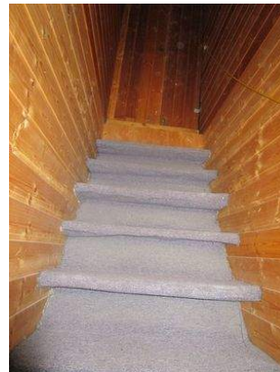
OG zum Dachspitz