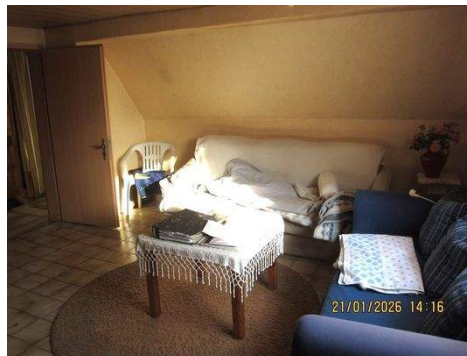
OG ZIMMER 1a.JPG