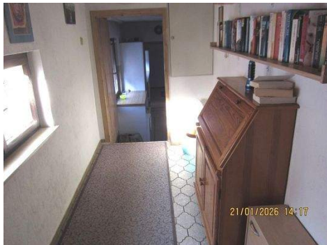
OG Gang 2b.JPG