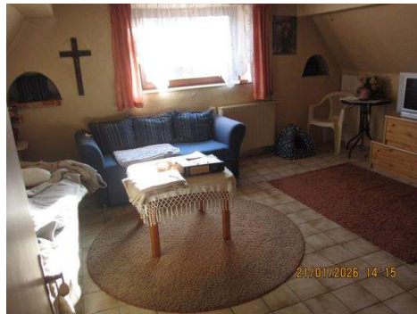
OG Zimmer 1c