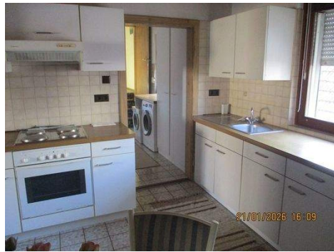
OG Küche, ( Zimmer 4).JPG