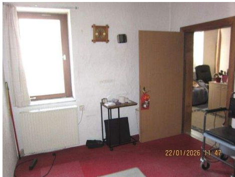
EG, Zimmer 1a.JPG