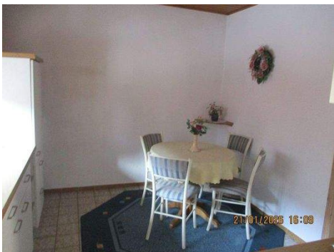
OG Küche / Esszimmer