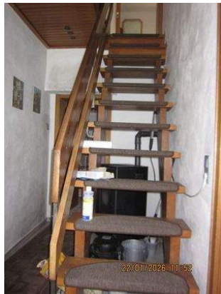
EG, Treppe zum OG.JPG