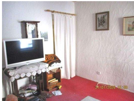
EG Zimmer 1b.JPG