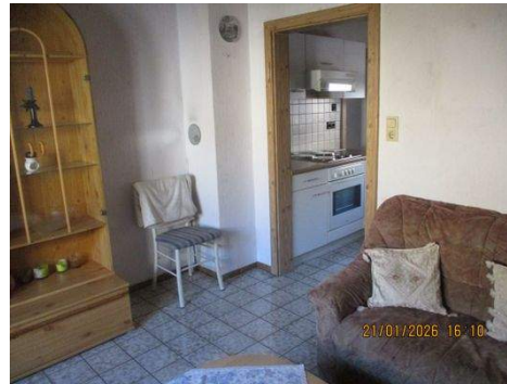
OG Zimmer 5d