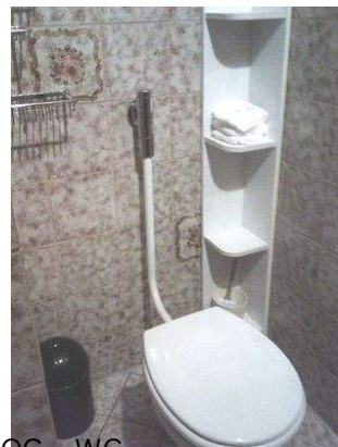
OG - WC Dusche.JPG