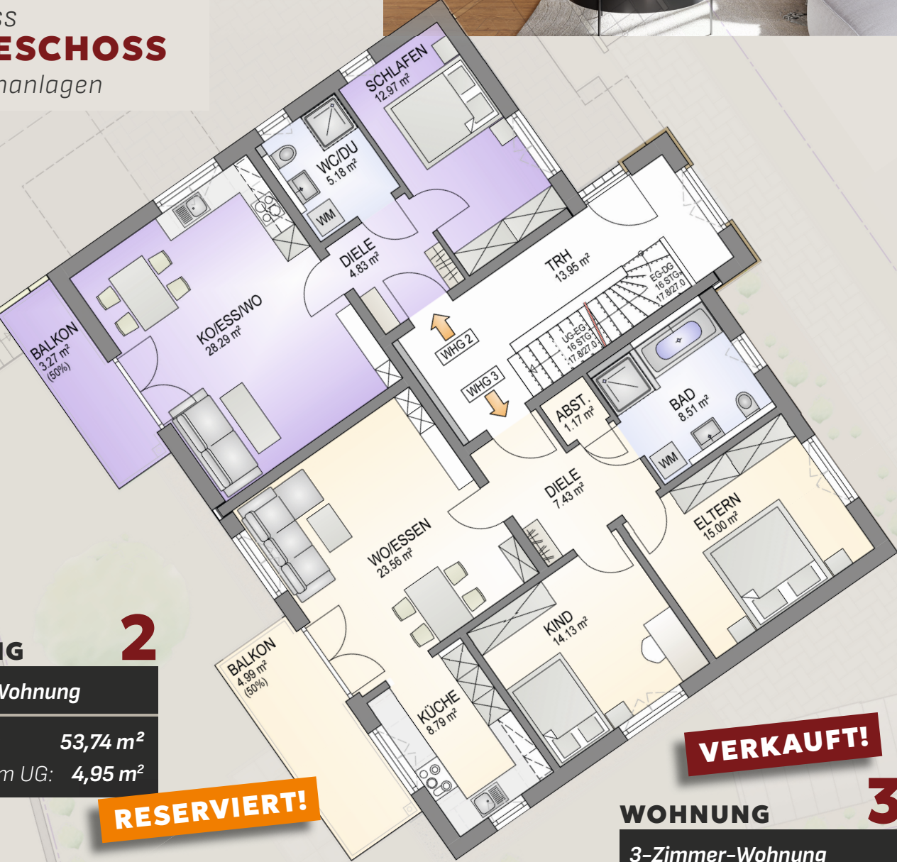
Grundriss ERDGESCHOSS mit Außenanlagen