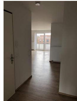
Flur mit Blick zum Wohnbereich