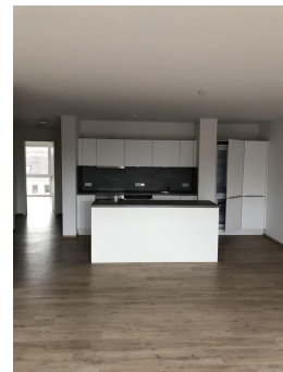
Küche mit Kücheninsel im Wohnbereich