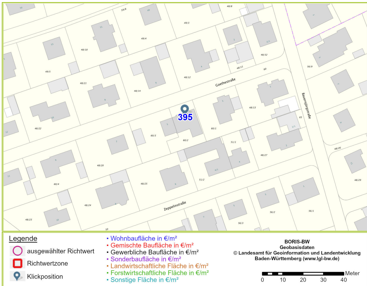
Abbildung 2: zentralisierte Darstellung der Klickposition mit den gewählten Einstellungen von Maßstab und Hintergrundkarte am Bildschirm

Der von Ihnen gewählte Bereich liegt in der Gemeinde/Stadt Bad Waldsee. Die Darstellung dieses Kartenbereichs kann durch den Anwender individuell beeinflusst werden, z.B. durch Ändern der Klickposition, des Zoommaßstabs oder der Auswahl der Hintergrundkarte.