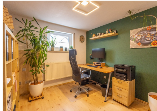
Büro im UG