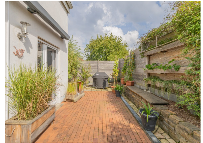
Kleiner, stilvoller Terrassenbereich