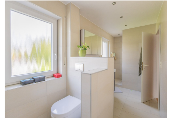
Modernisiertes Bad im OG mit Badewanne und Dusche