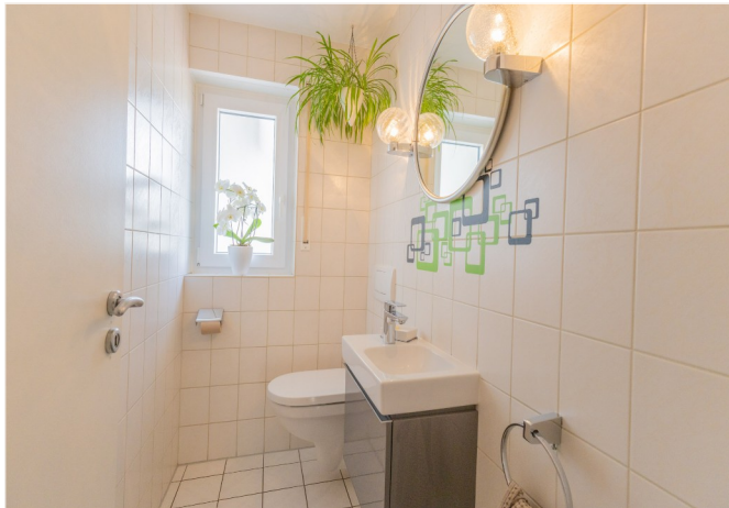
GWC im EG