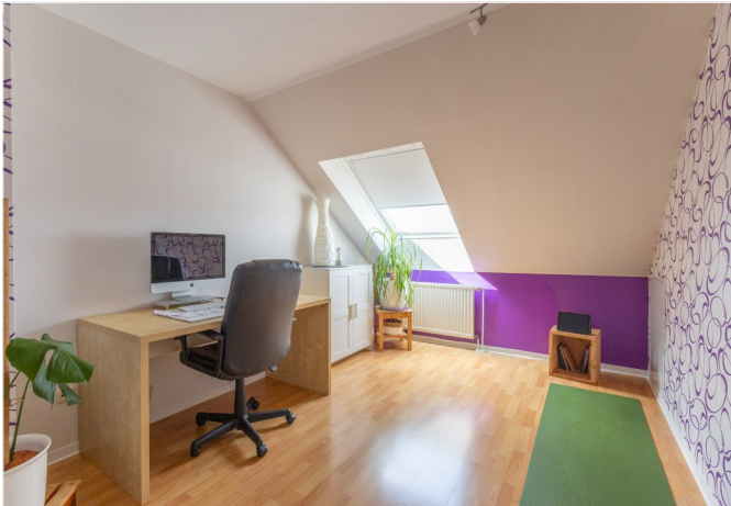
Arbeitszimmer im OG