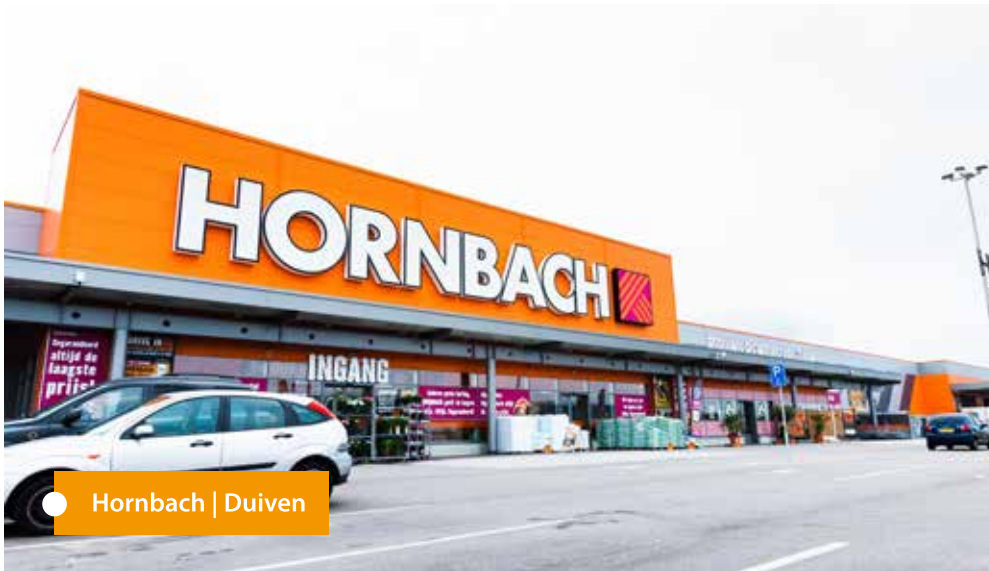
● Hornbach | Duiven

Bestens vorbereitet für eine langfristige Nutzung: Mit eigenen Spezialisten und Fachkräften übernehmen wir sämtliche kaufmännische und technische Aufgaben des Immobilienmanagements im gesamten Lebenszyklus der Immobilie.