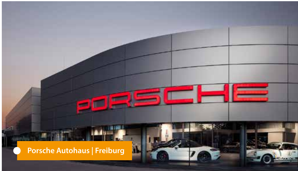
● Porsche Autohaus | Freiburg