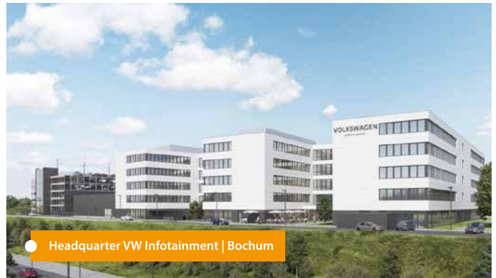
● Headquarter VW Infotainment | Bochum