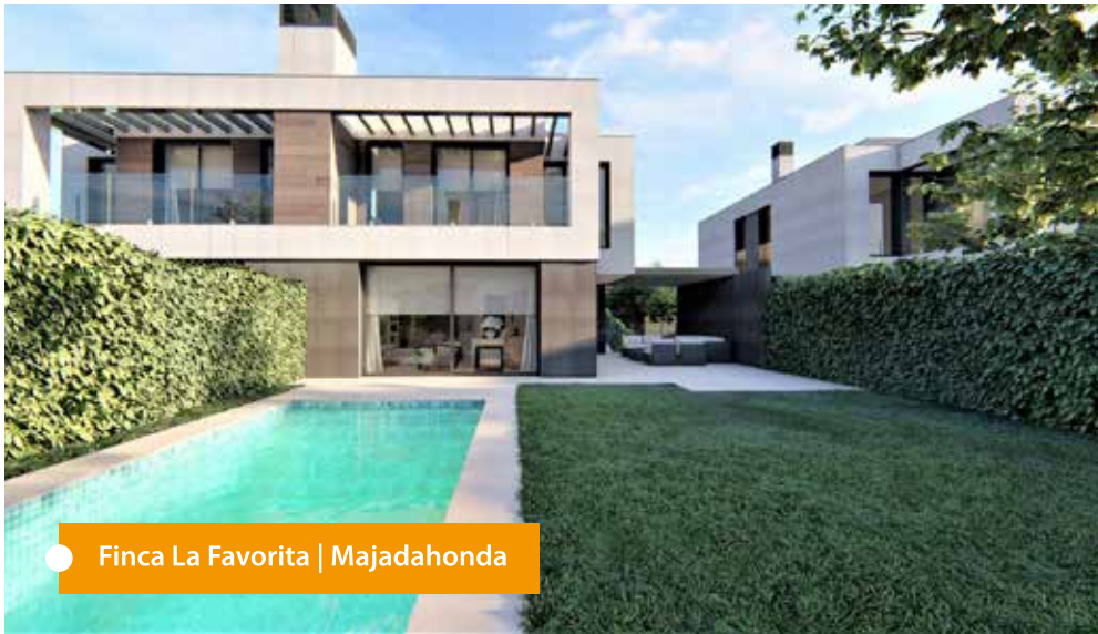
● Finca La Favorita | Majadahonda