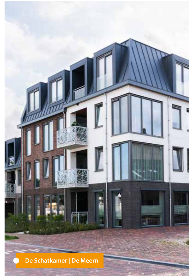
De Schatkamer | De Meern

Auch das Thema Energieeffizienz ist für uns von großer Bedeutung. Es wird sowohl bei der Entstehung neuer Gebäude als auch während der Nutzungsphase und im Zuge des Rückbaus von uns mit einbezogen. Eine moderne Gebäudetechnik trägt entscheidend zum sparsamen Umgang mit Ressourcen bei.