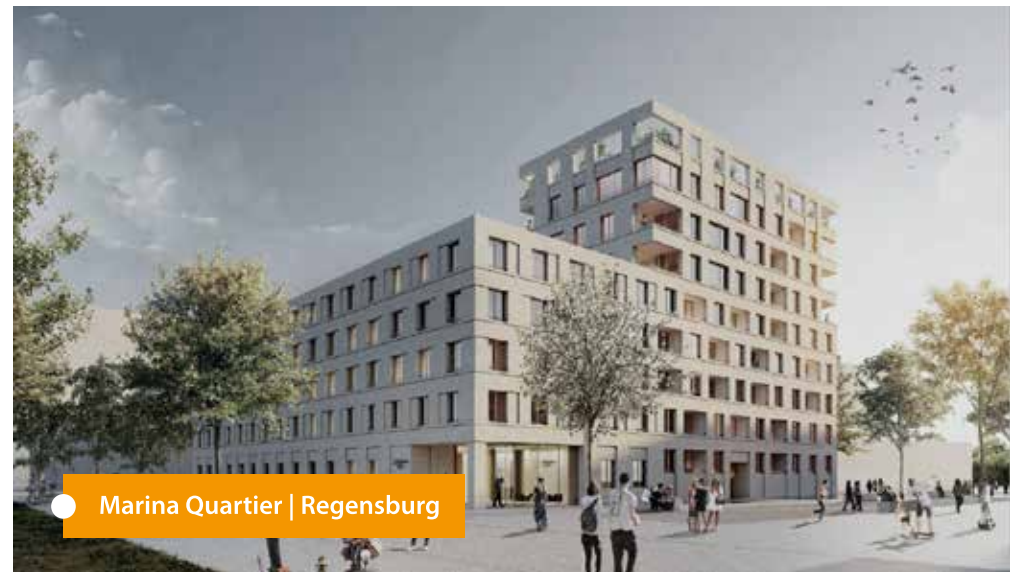
● Marina Quartier | Regensburg