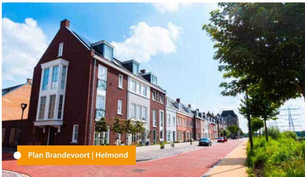
● Plan Brandevoort | Helmond