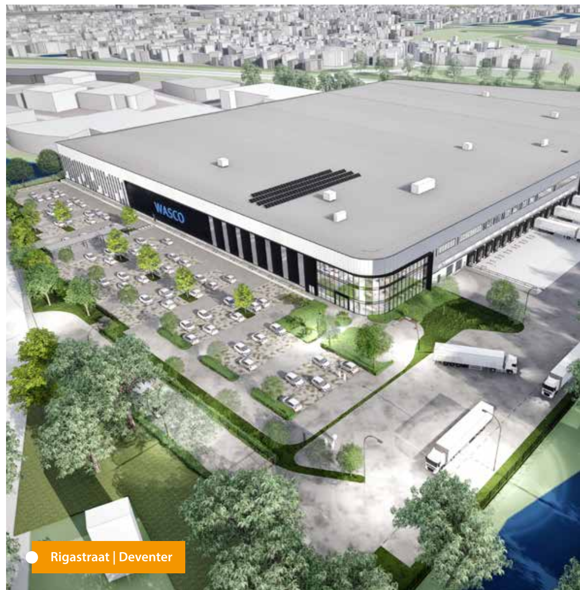
● Rigastraat | Deventer

Indem wir Sie vom ersten Entwurf an am Bauprozess beteiligen, sorgen wir für ein optimales Ergebnis hinsichtlich der technischen Umsetzung, der Qualität, der Zeitplanung und des Preises. Eine Vielzahl zufriedener Kunden wird Ihnen bestätigen: Wir garantieren höchste Transparenz vom Anfang bis zum Ende - auch was die Kosten betrifft. Mit diesem Ansatz haben wir in der Vergangenheit bereits eine riesige Anzahl an Projekten erfolgreich realisieren können, die auch langfristig Bestand haben.