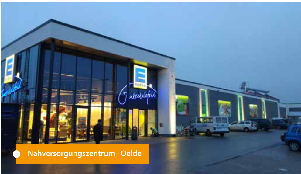
● Nahversorgungszentrum | Oelde