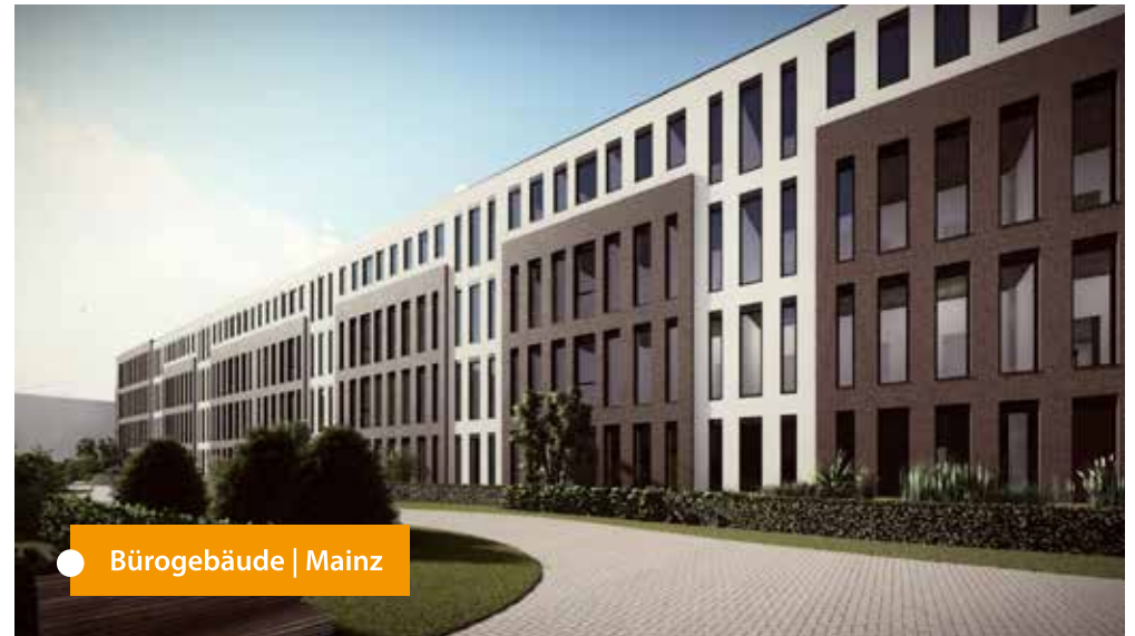
● Bürogebäude | Mainz

Verschiedene Leistungen für unterschiedliche Projekte: So vielseitig wie unsere Mitarbeiter und Leistungen sind auch unsere Bauprojekte. So entwickeln wir z.B. Büroimmobilien, Wohn- und Geschäftshäuser, Einkaufs- und Fachmarktzentren, Vollsortimenter, Discounter, Hotels, Logistikzentren, Tankstellen, Restaurants, Sportstätten, Senioren- und Pflegezentren, Kliniken oder sonstige öffentliche Einrichtungen. Die Revitalisierung und das Refurbishment von Handelsobjekten sind ebenfalls Teil unseres umfangreichen Tätigkeitsfeldes.