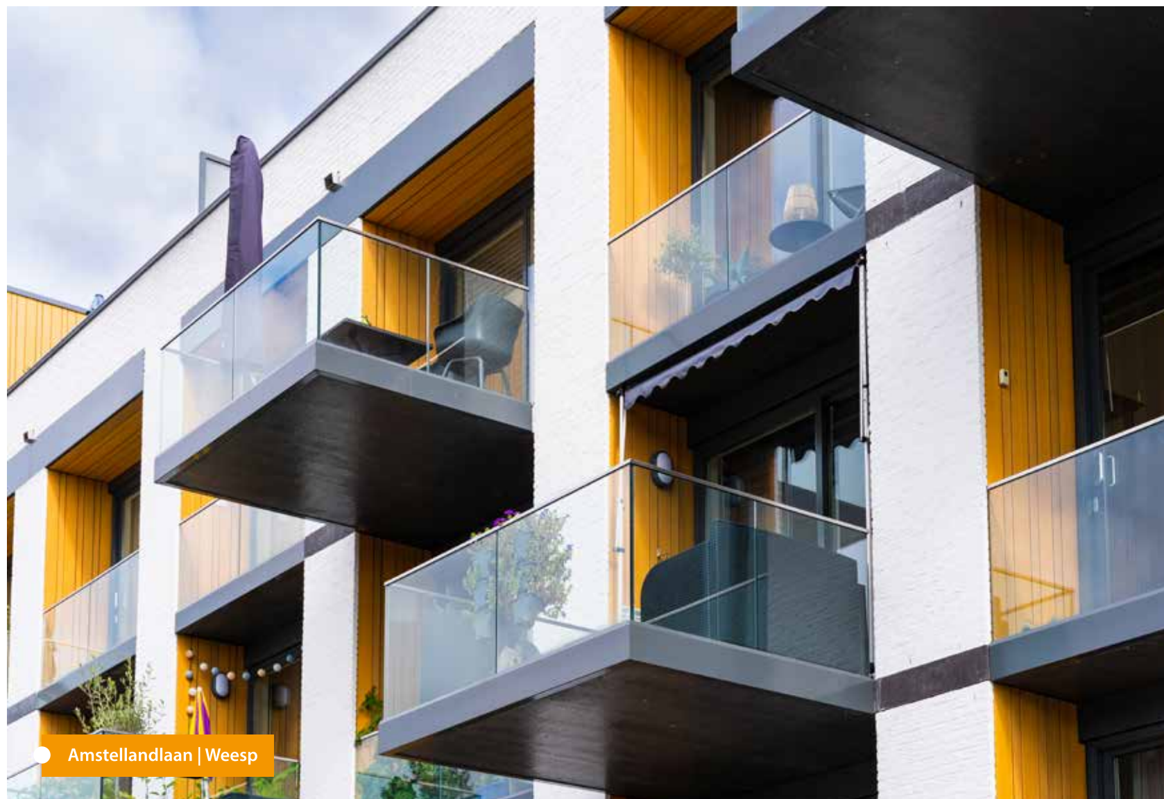
Amstellandlaan | Weesp