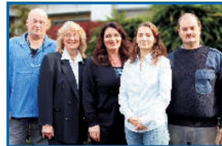
Wir schaffen Ihnen Freiräume

Gerne präsentieren wir Ihnen Ihr neues Büro bei einer unverbindlichen Besichtigung.