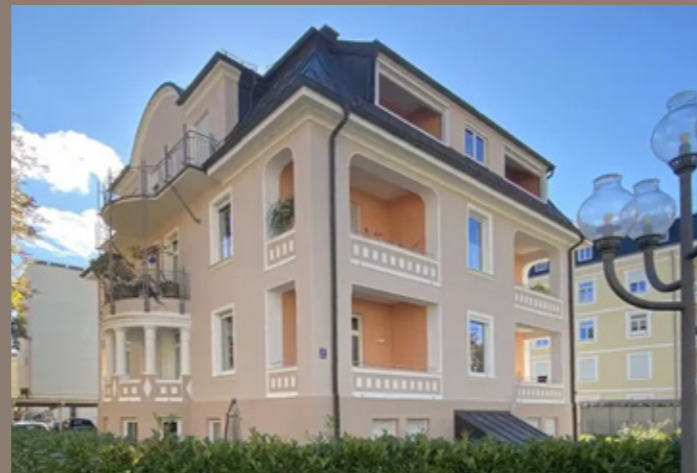
VERKAUF Bad Reichenhall - Eigentumswohnung in Altbauvilla