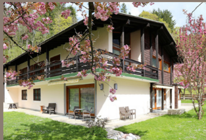
VERKAUF Schönau am Königssee - Wohn- und Geschäftshaus