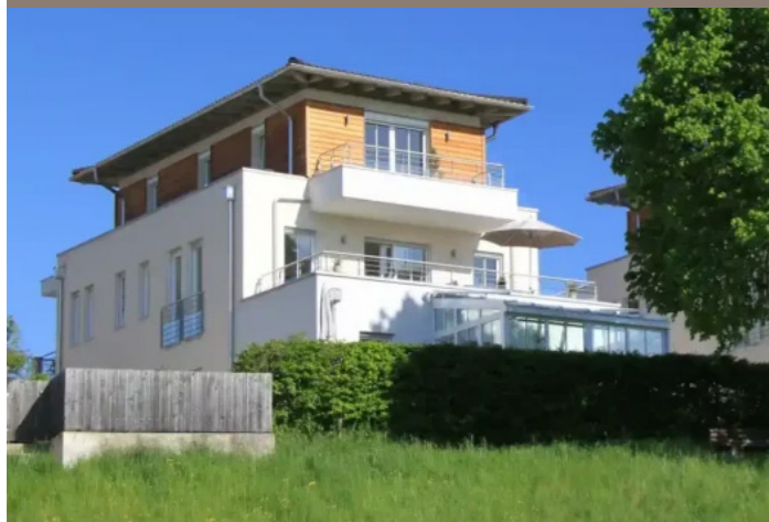
VERKAUF Freilassing - Penthouse