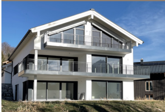
VERKAUF Berchtesgaden - Eigentumswohnungen

In den vergangenen Jahren haben wir eine Vielzahl an Immobilien erfolgreich verkauft - von klassischen Wohnungen und Penthäusern, über Einfamilien- und Mehrfamilienhäuser im Bestand, bis hin zu Neubauimmobilien für Bauträger.