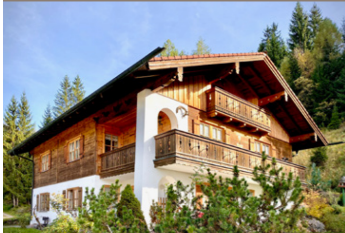
VERKAUF Berchtesgaden - Mehrfamilienhaus

In den vergangenen Jahren haben wir eine Vielzahl an Immobilien erfolgreich verkauft - von klassischen Wohnungen und Penthäusern, über Einfamilien- und Mehrfamilienhäuser im Bestand, bis hin zu Neubauimmobilien für Bauträger.