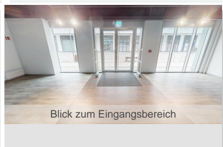
Blick zum Eingangsbereich