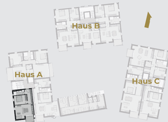
Erstes Obergeschoss - Etagenansicht