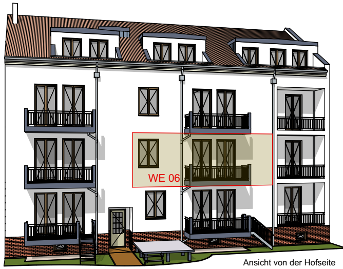
Ansicht von der Hofseite