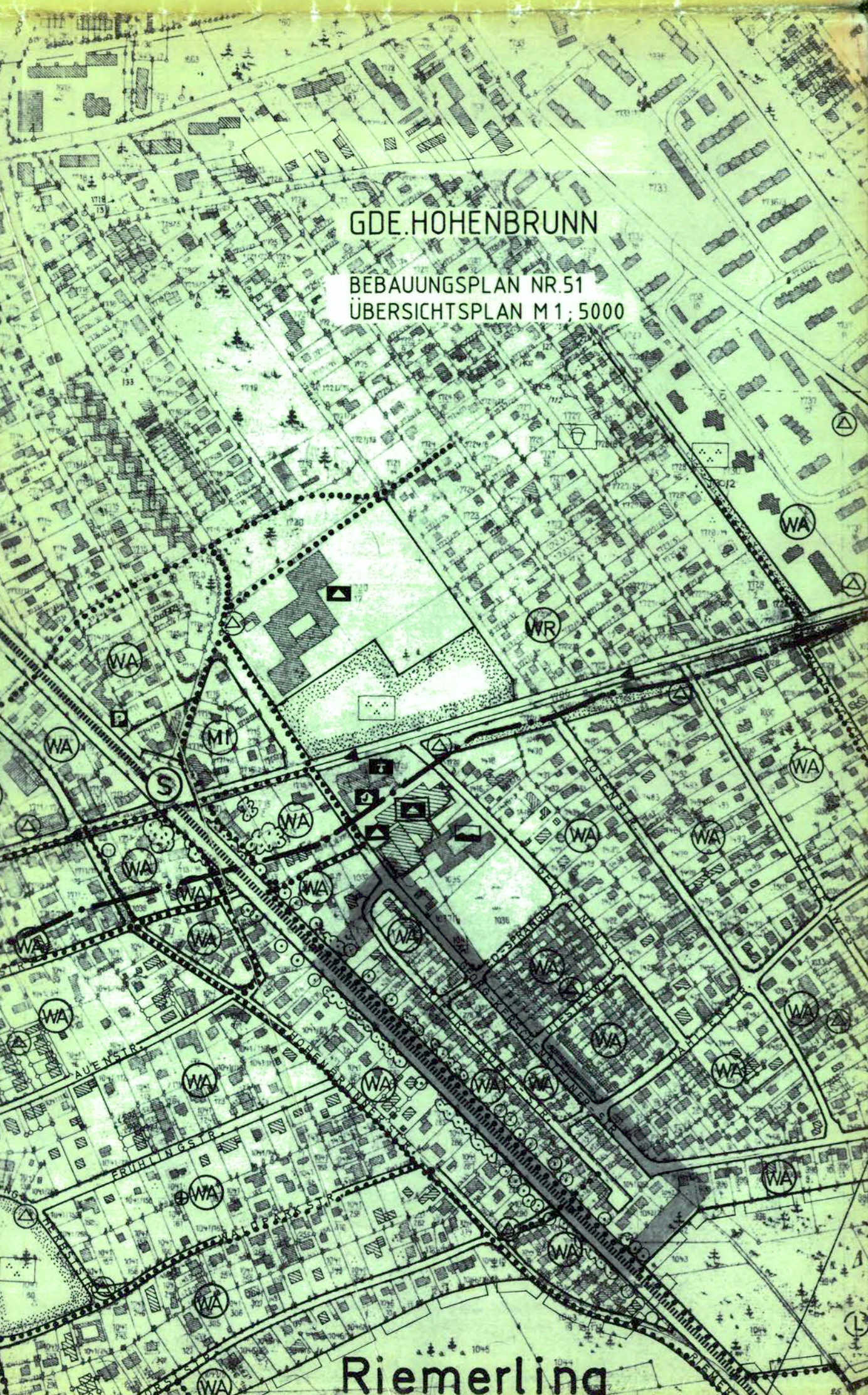
GDE HOHENBRUNN BEBAUUNGSPLAN NR 51 ÜBERSICHTSPLAN M 1:5000