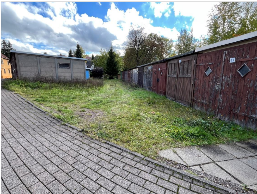
Abbildung 4 Blick von der Straße Heinrichsbach