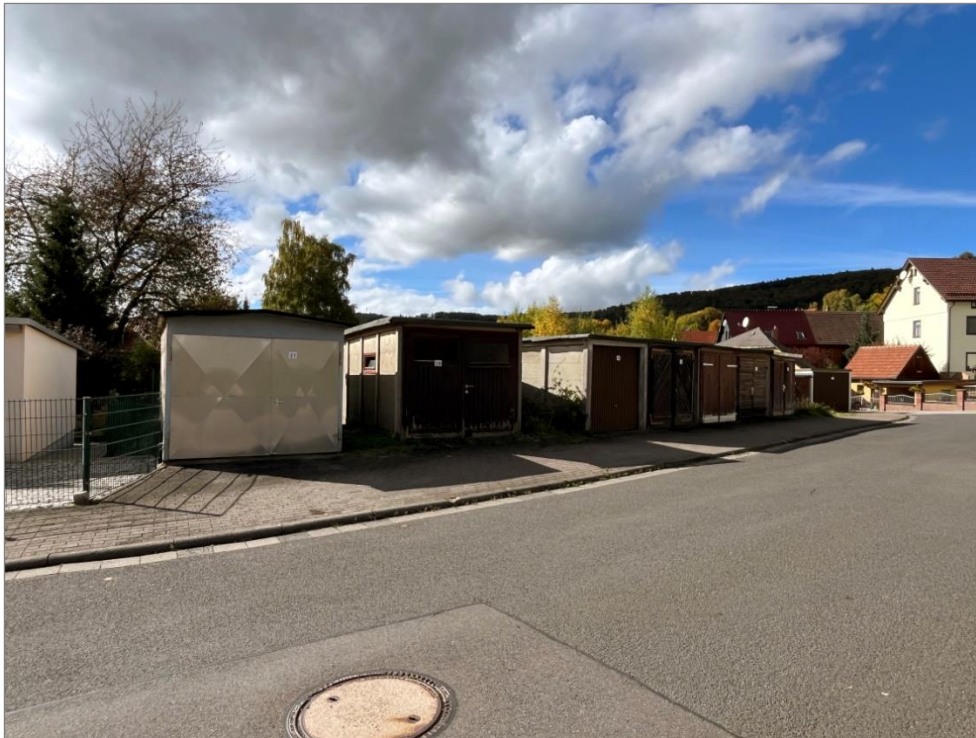
Abbildung 3 Blick vom Augustweg