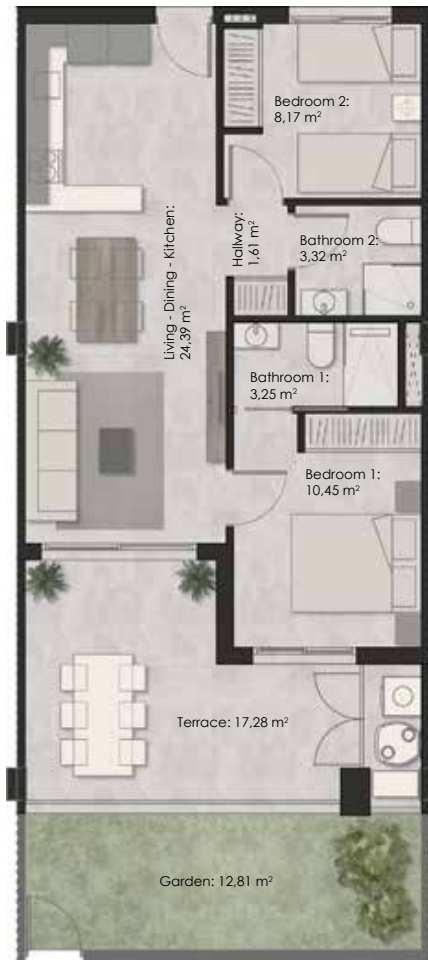
APARTMENT TYPE A - FLOOR 0: 2 BEDS & 2 BATHS + GARDEN APARTAMENT TYP A - PIĘTRO 0: 2 ŁÓŻKA I 2 ZAZIENKI + OGRÓD

TOTAL BUILT AREA: 78,06 sq.m. CAŁKOWITA POWIERZCHNIA ZBUDOWANA