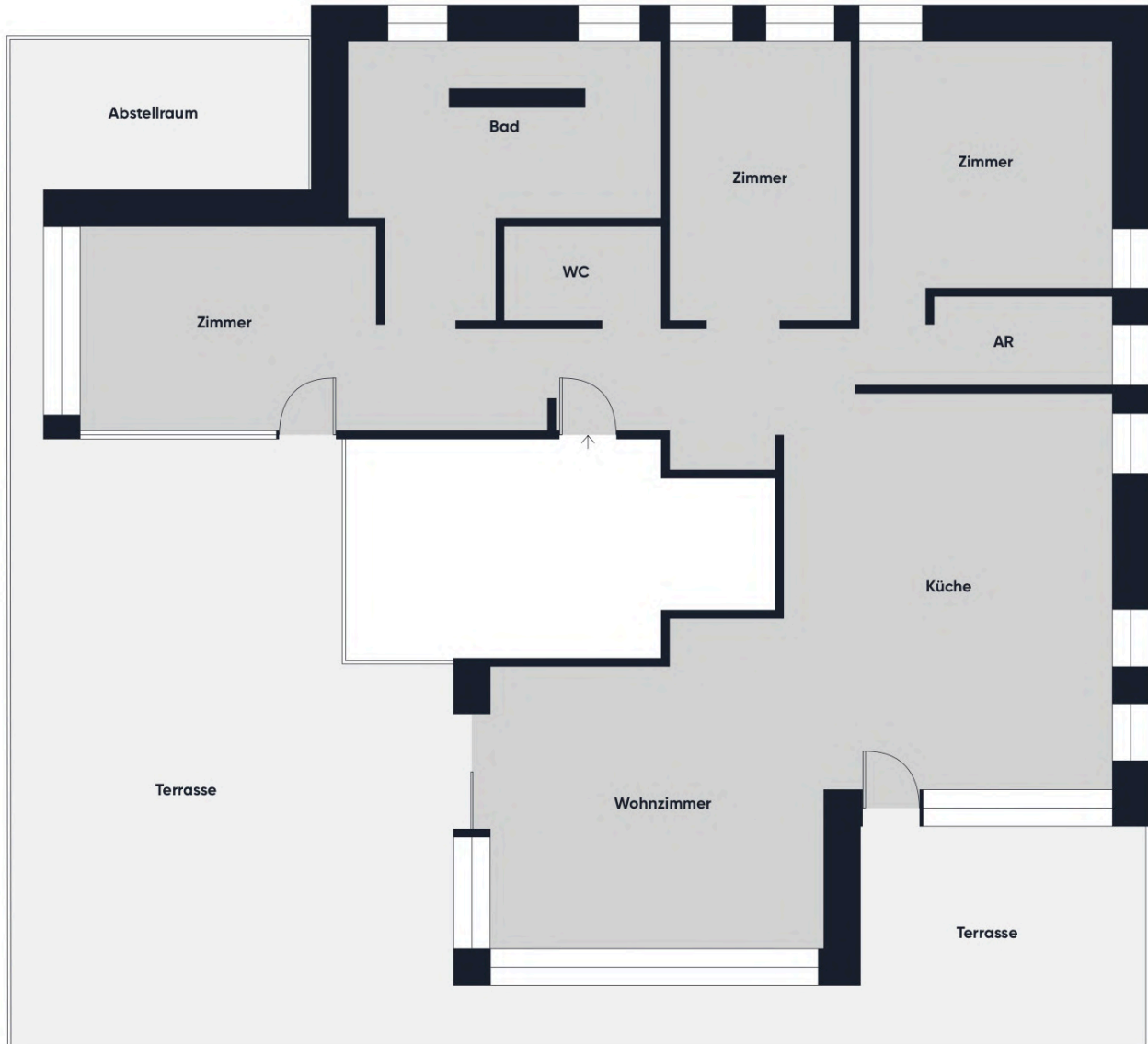
Grundrissplan ohne Maßstab