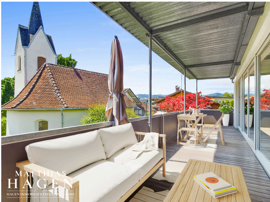
Terrasse mit Einrichtungsvorschlag