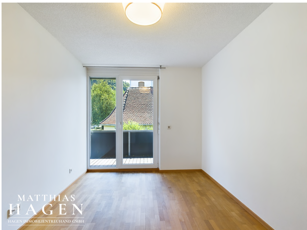
Schlafzimmer mit Einrichtungsvorschlag

MATTHIAS HAGEN HAGEN IMMOBILIENTREUHAND GMBH