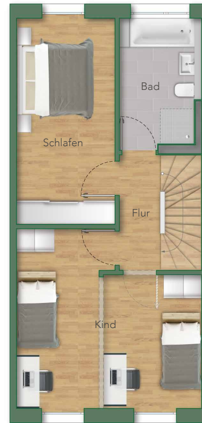
— OG —