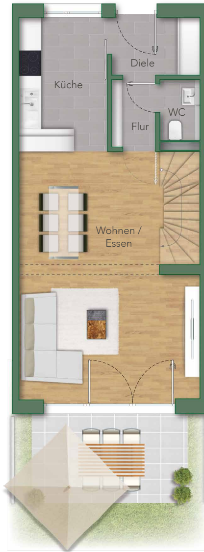
— EG —

Wohnfläche: Konstruktionsbedingte Änderungen vorbehalten