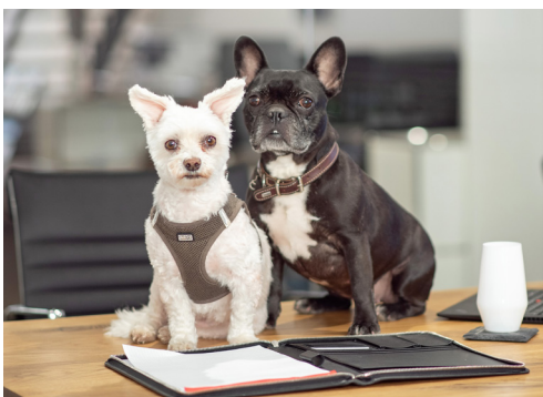
RUBI & BELLA