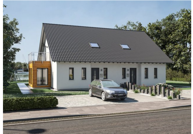
Ihre Doppelhaushälfte in Freimann