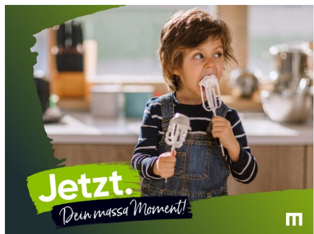
Dein massa haus Moment