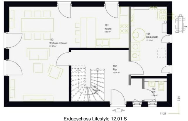
Erdgeschoss Lifestyle 12.01 S

Makler-Provision 4% auf das Grundstück 24.000€ netto, Grundstück-Preis 600.000€