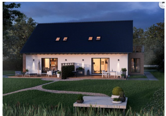
Bilder beispielhaft, Kniestock wird erhöht!