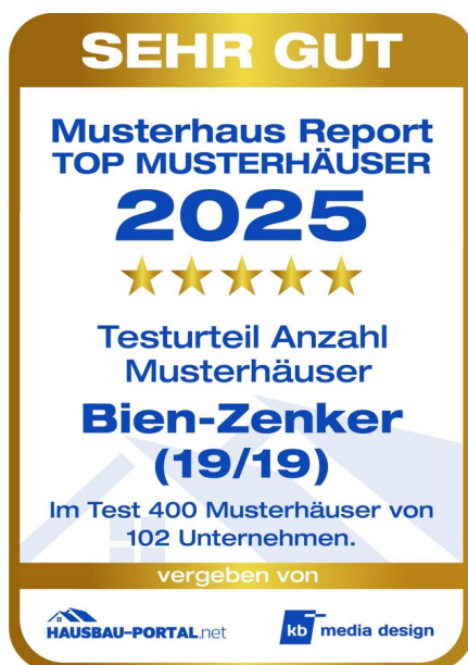
Musterhaus Report 2025