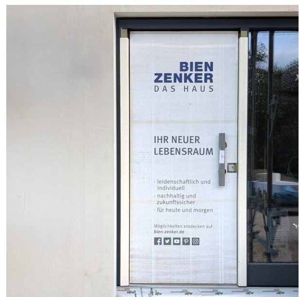
Tür zum Wohnglück