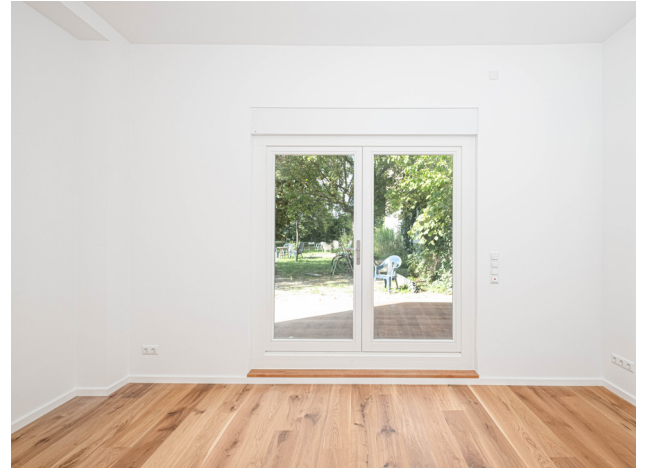
Schlafzimmer mit Terrassenzugang