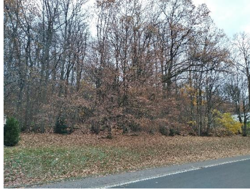
Ansicht – rechte Seite