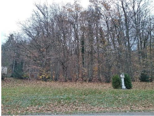
Ansicht – linke Seite