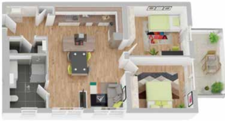
Haus B2: Wohneinheit 6

Barrierearmer Zugang Aufzugsanlage in Haus B1+B2