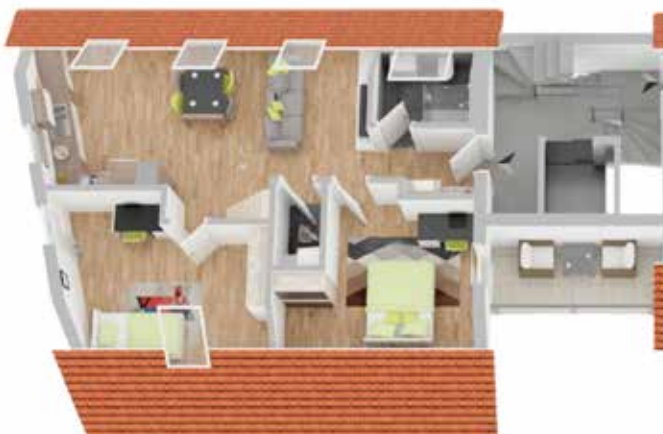
Haus B1: Wohneinheit 7