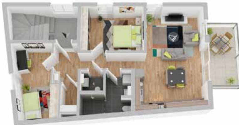
Haus A: Wohneinheit 2

Details zu dieser Obergeschosswohnung in Haus A: