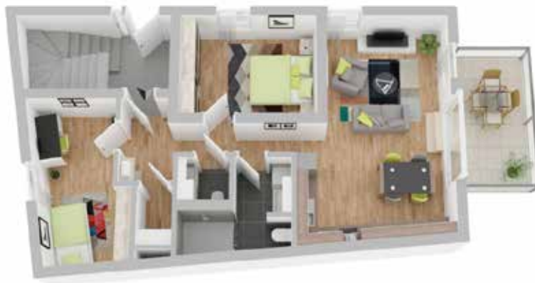
Haus A: Wohneinheit 1

Details zu dieser Erdgeschosswohnung in Haus A: