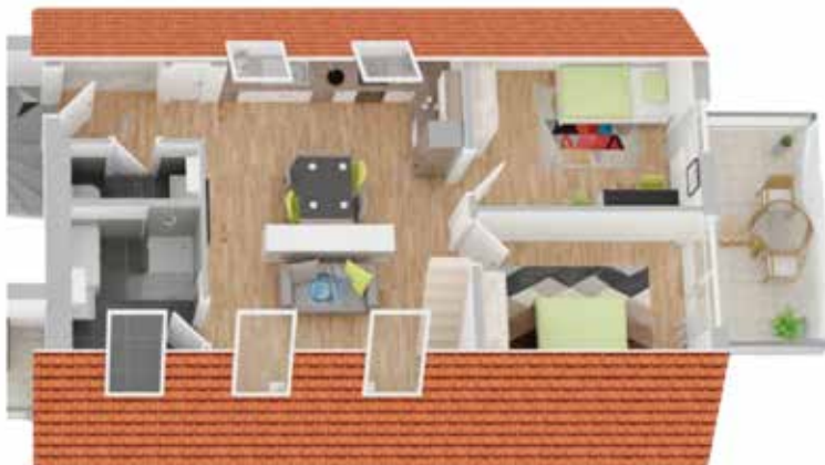
Haus B2: Wohneinheit 8

Details zu dieser Dachgeschosswohnung in Haus B2: