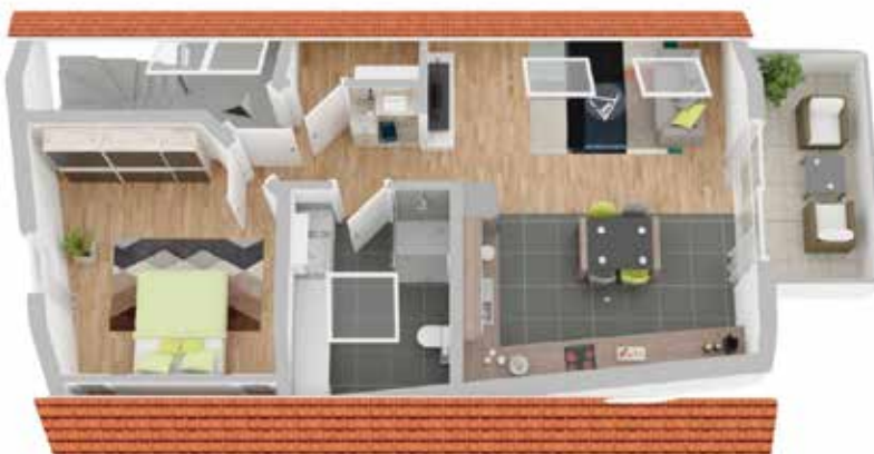
Haus A: Wohneinheit 3

Details zu dieser Dachgeschosswohnung in Haus A: