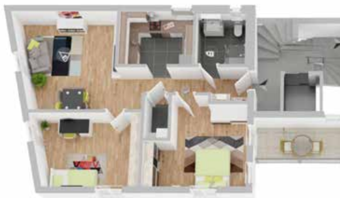
Haus B1: Wohneinheit 5

Details zu dieser Dachgeschosswohnung in Haus B1: