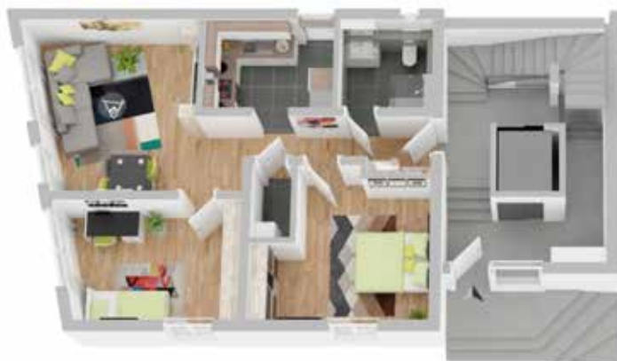
Haus B1: Wohneinheit 4

Details zu dieser Obergeschosswohnung in Haus B1: