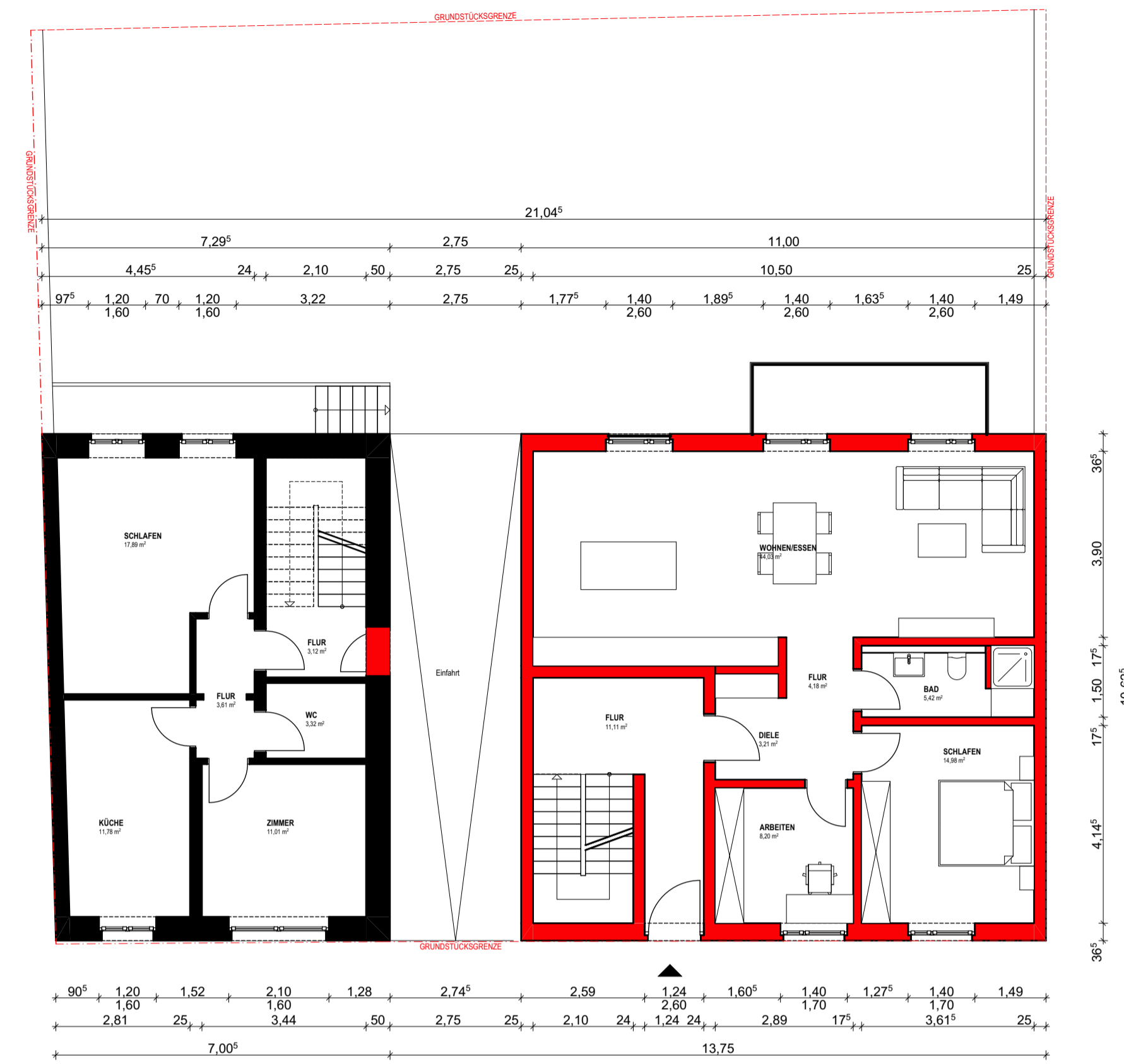
GRUNDRISS ERDGESCHOSS 1:100