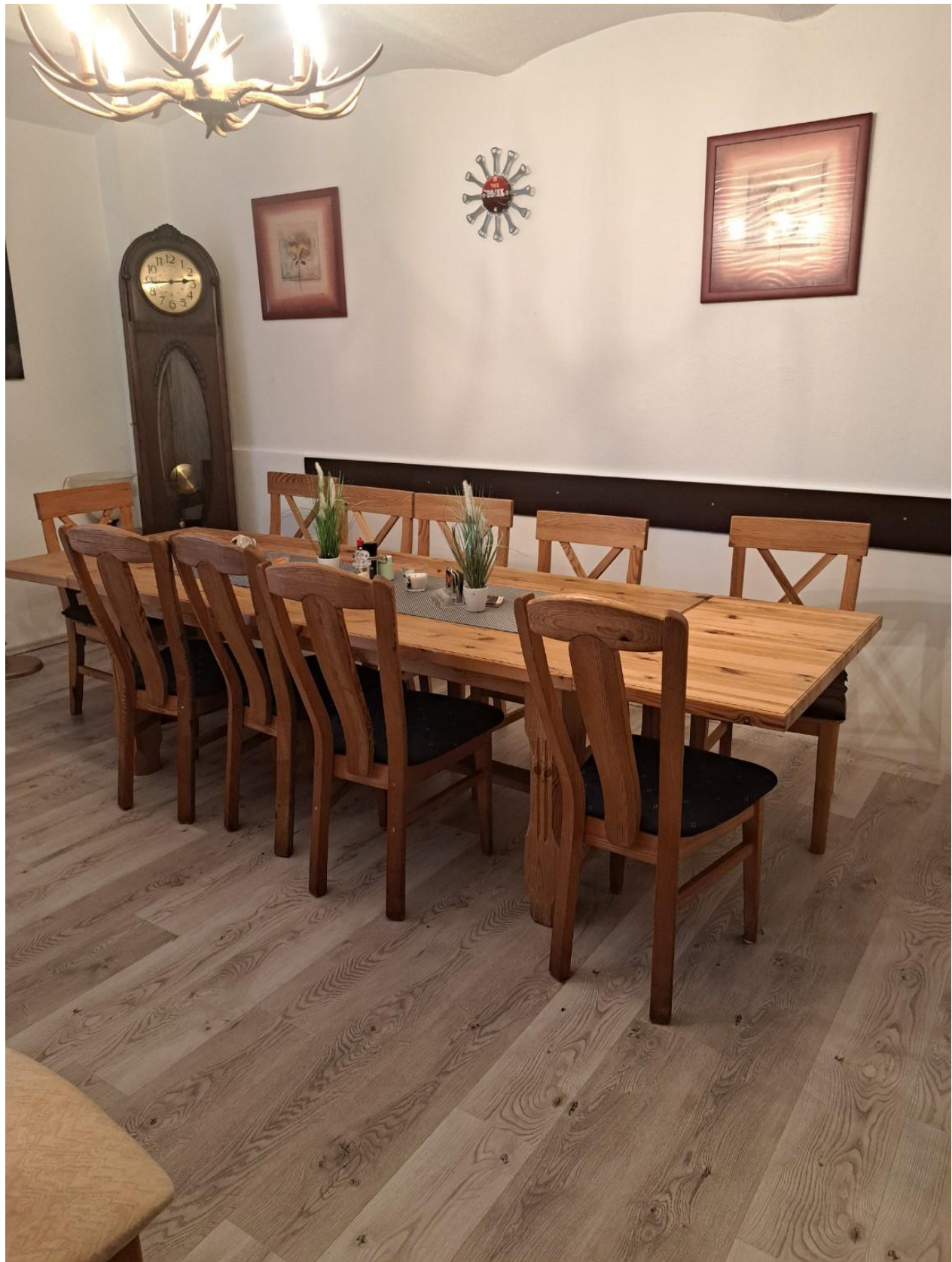
Nebenzimmer ausgebaut Scheune