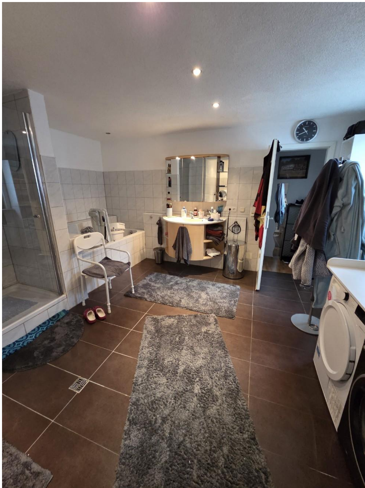
Bad EG vorne