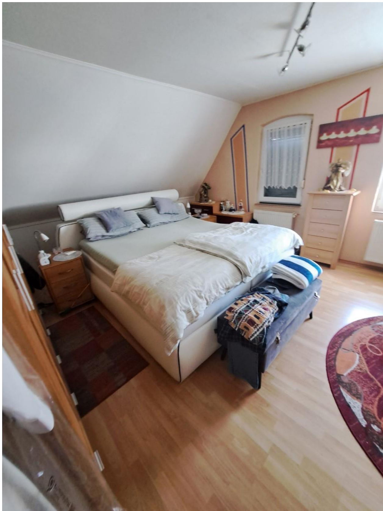
Schlafen OG vorne