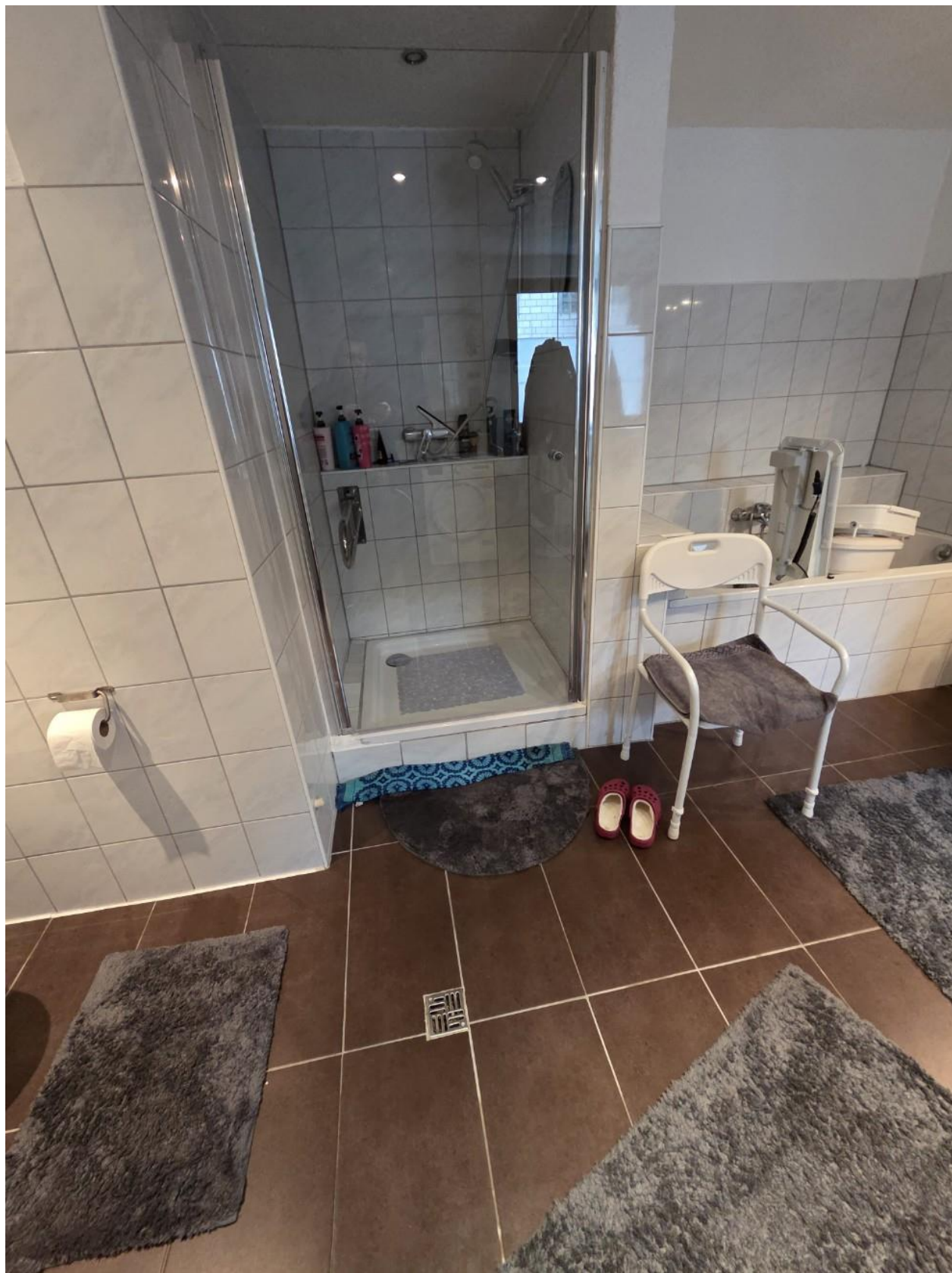
Bad EG vorne