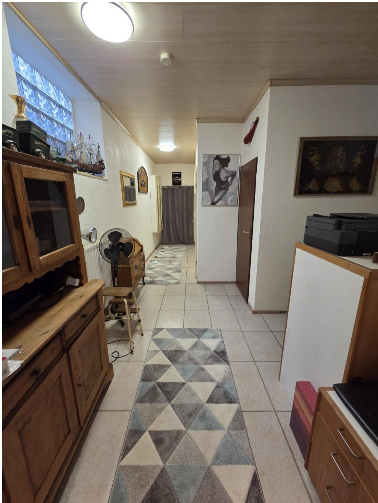
Flur EG vorne