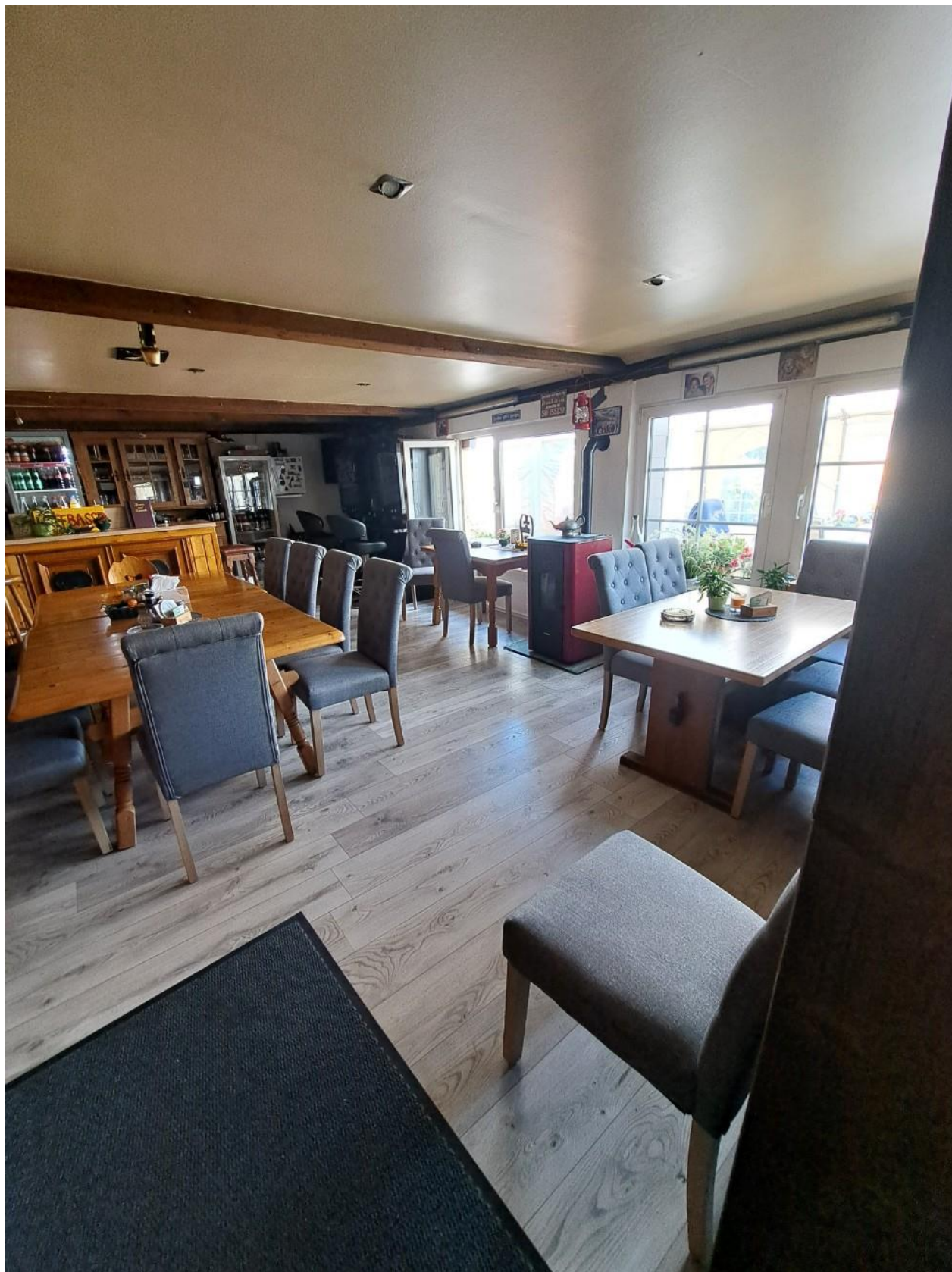
Gastro ausgebaute Scheune