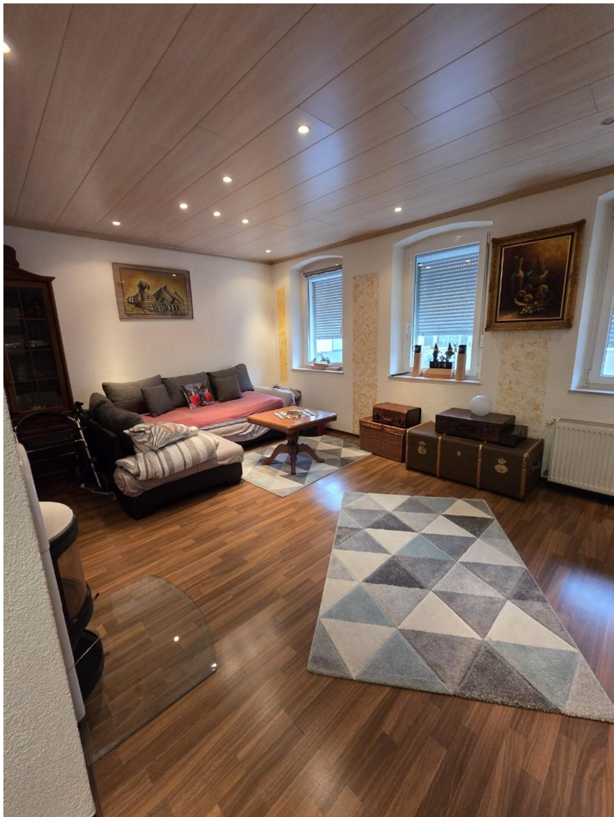
Wohnen EG vorne