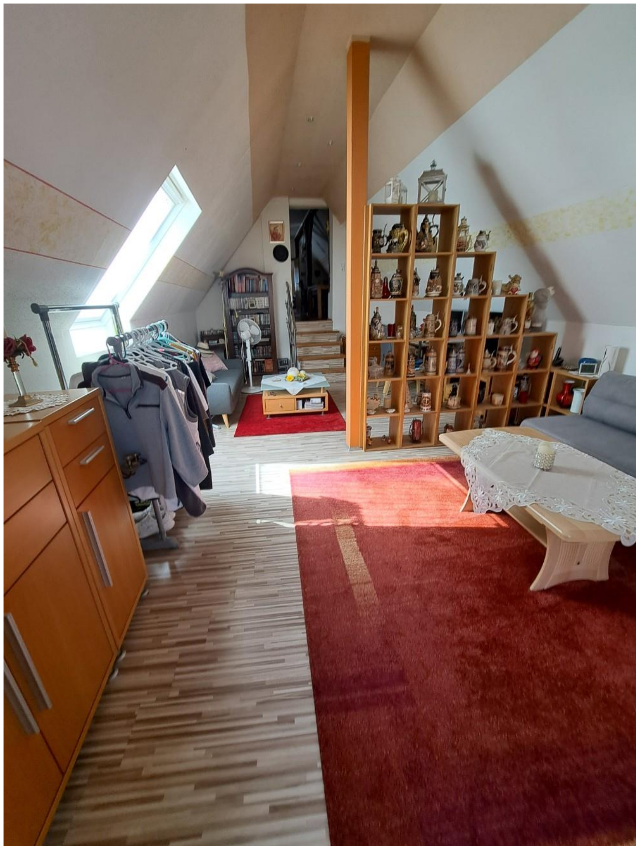
Wohnen Og hinten