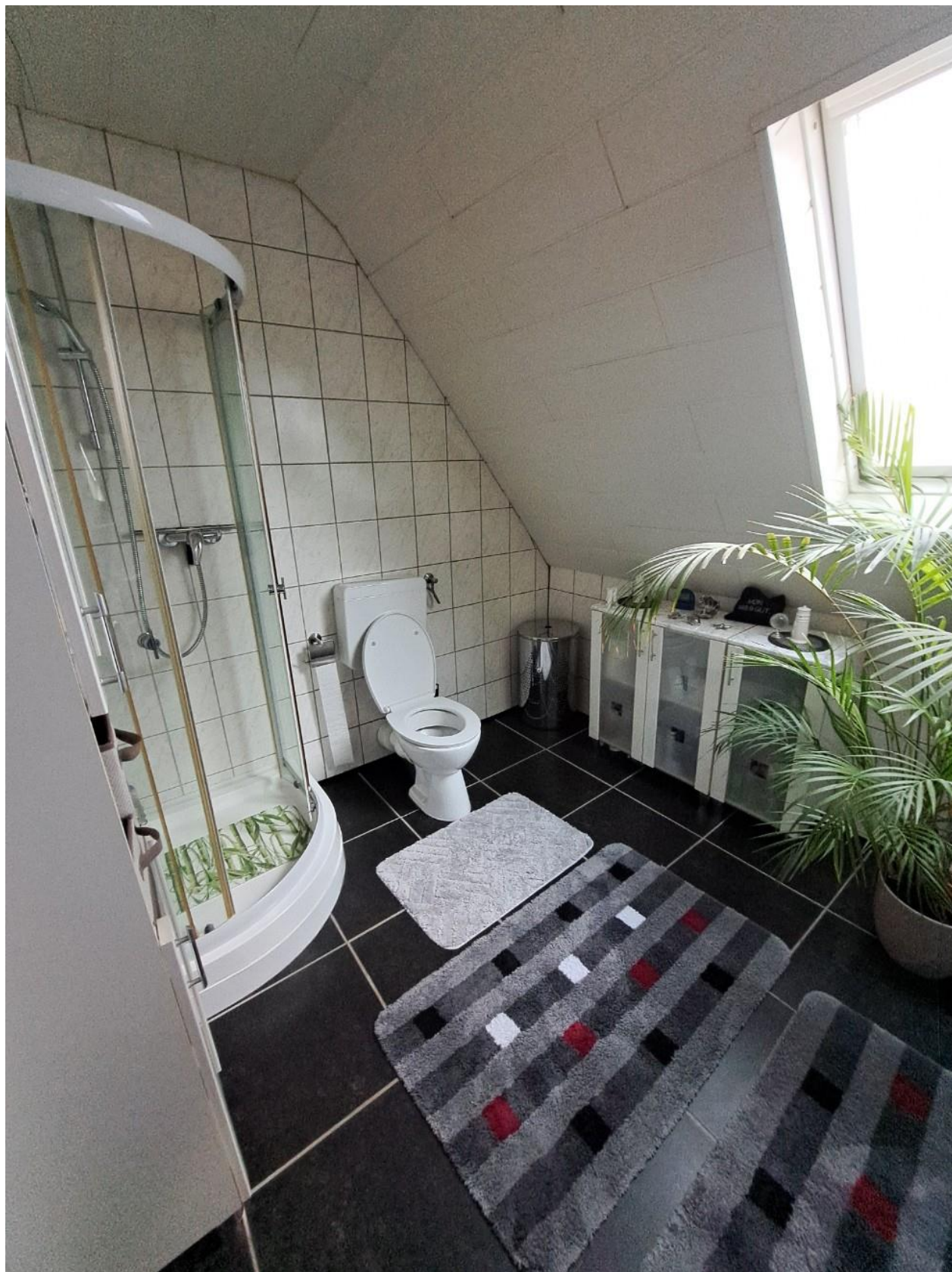
Bad OG vorne