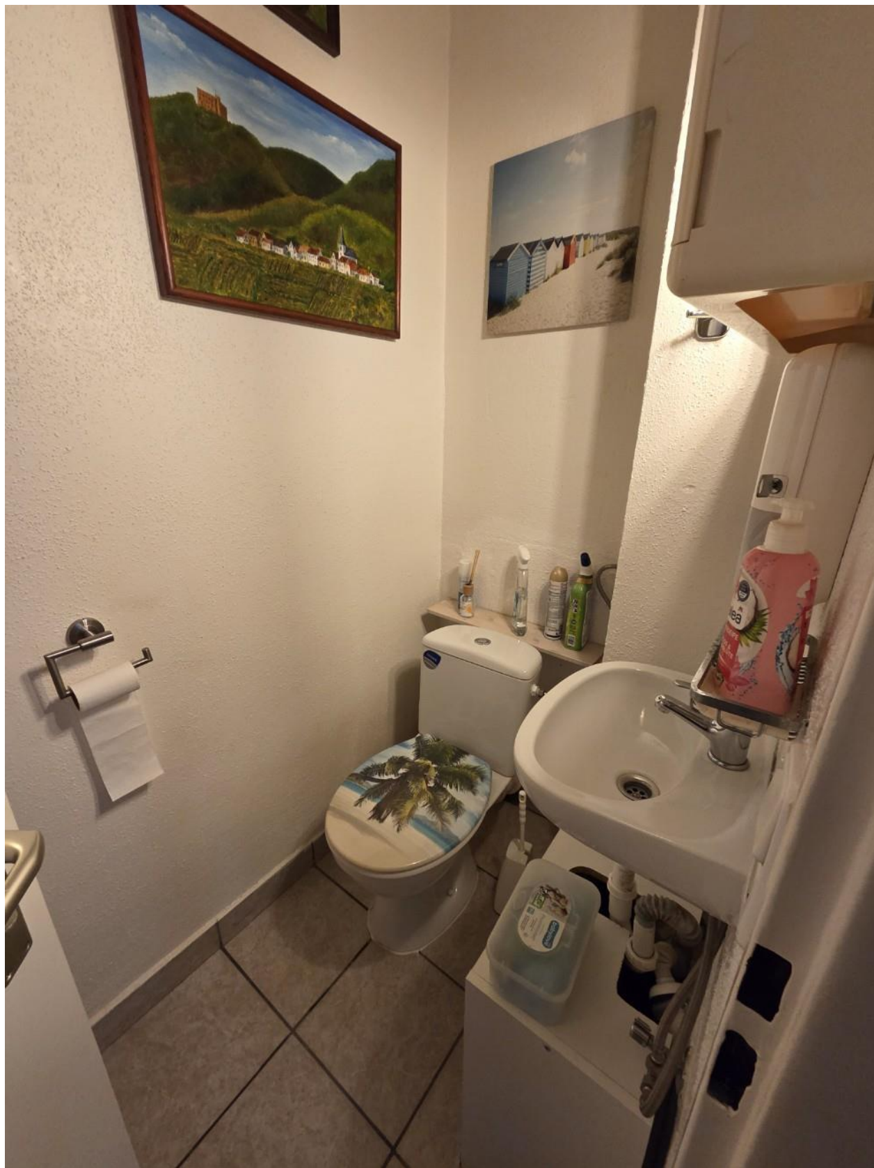
Gäste-WC EG vorne