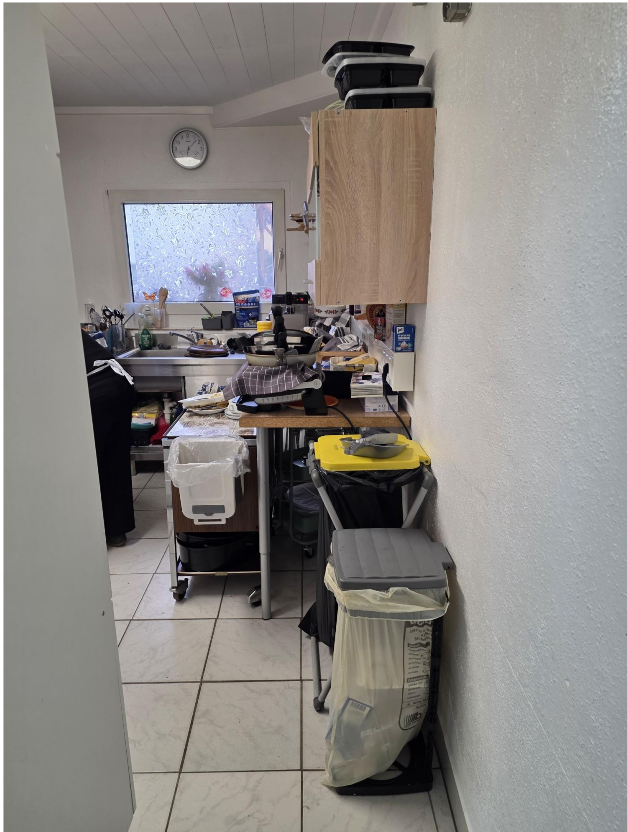
Küche Gastro ausgebaute Scheune