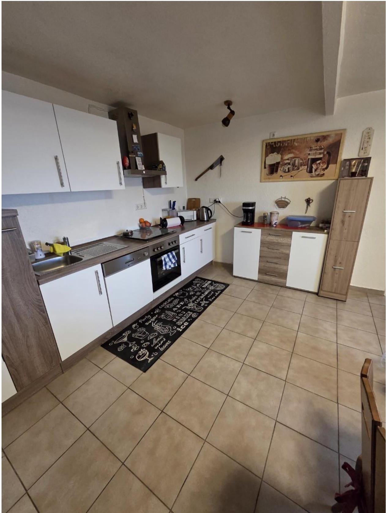
Küche EG vorne