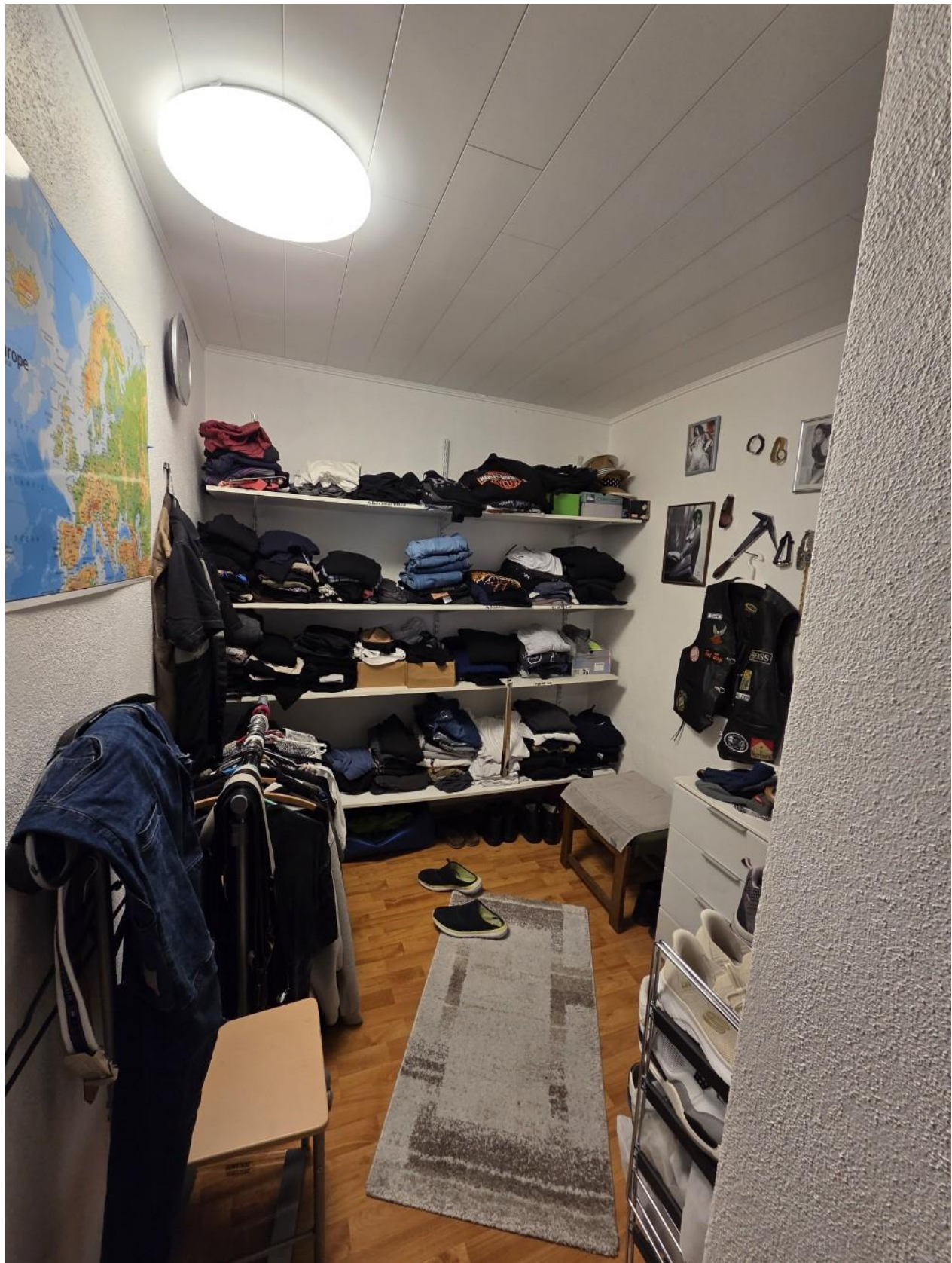
Ankleide hinter Bad EG vorne