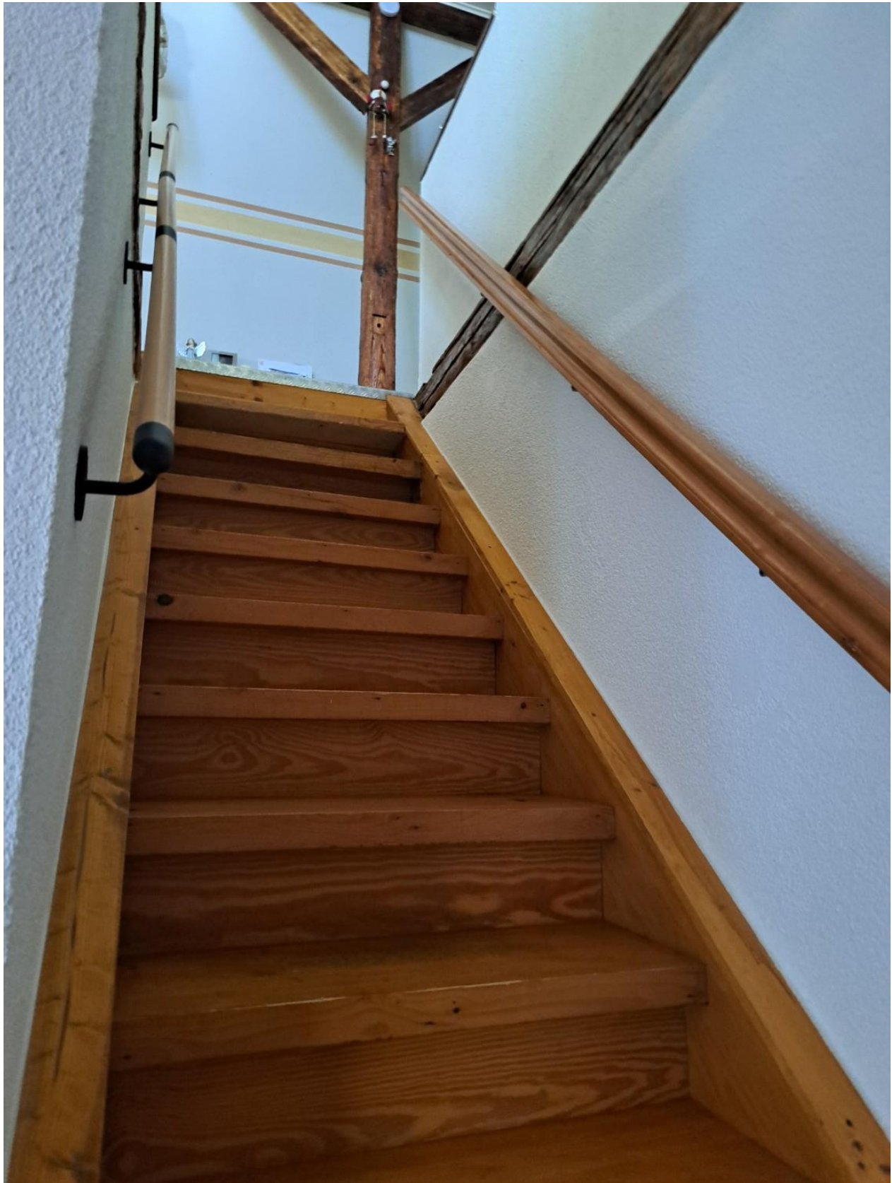
Aufgang Wohnen OG vorne