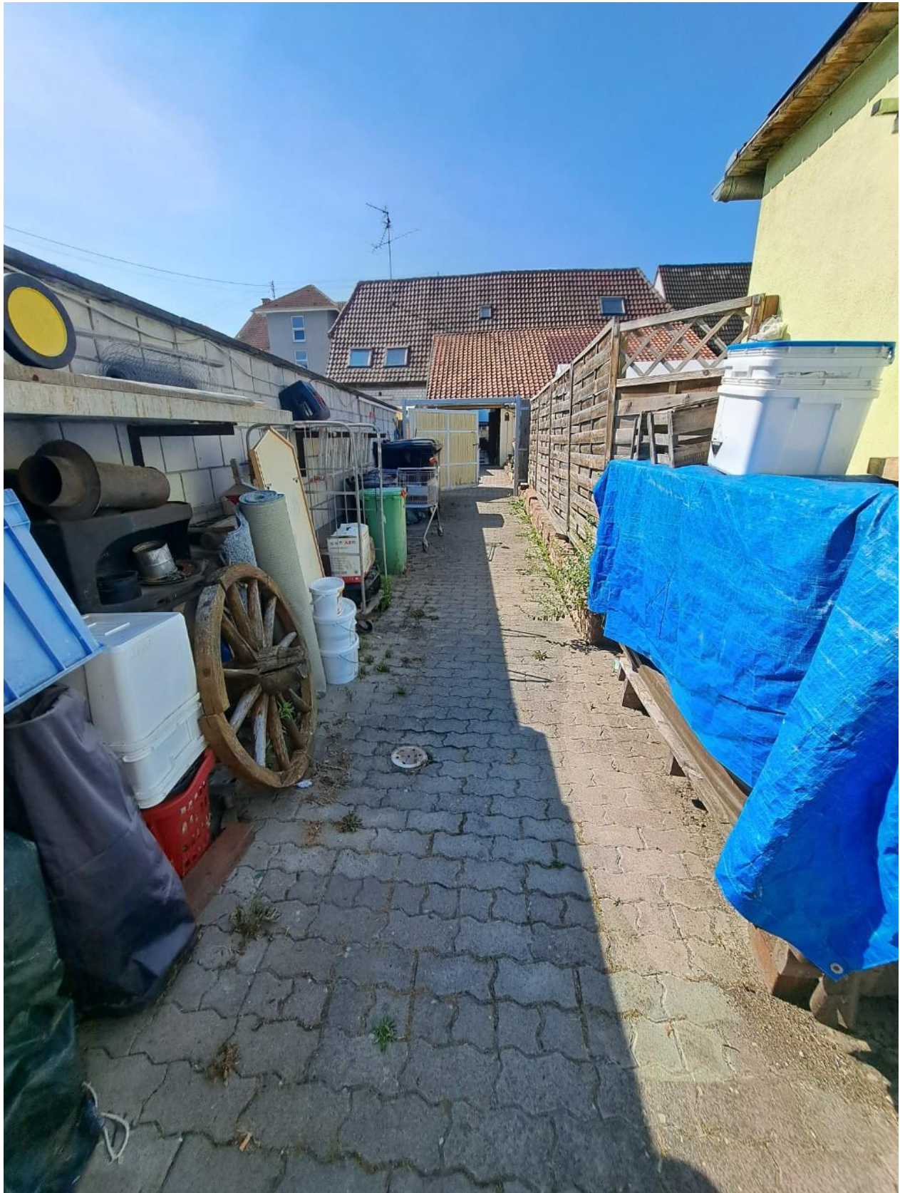
Weg zum Lager und Schuppen