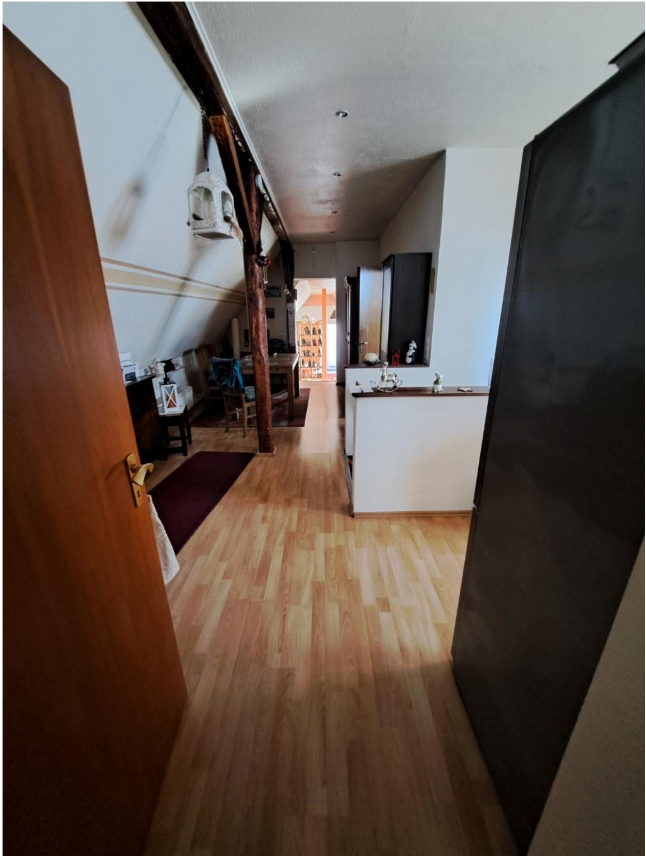
Flur Küche zu Wohnen hinten OG