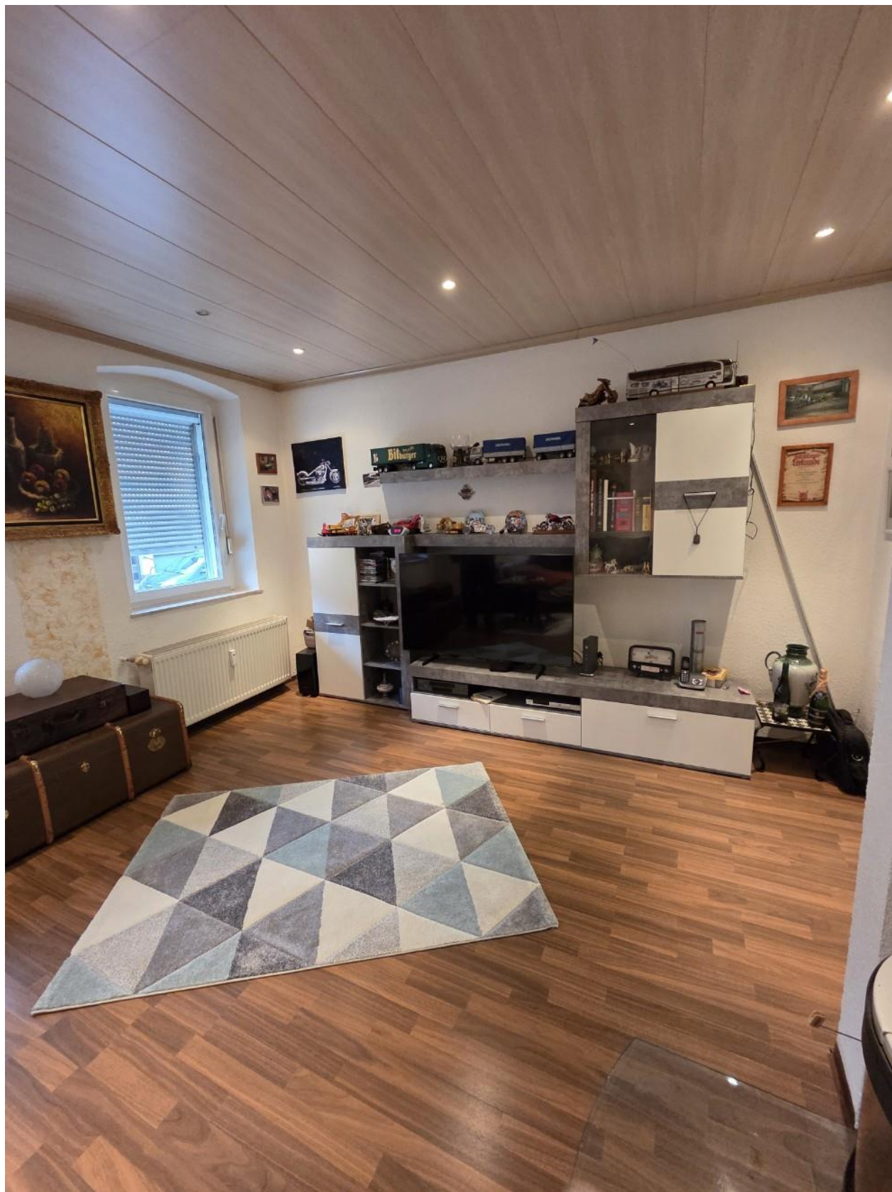
Wohnen EG vorne