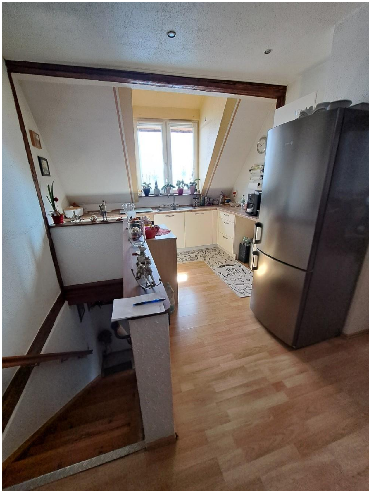
Küche OG vorne