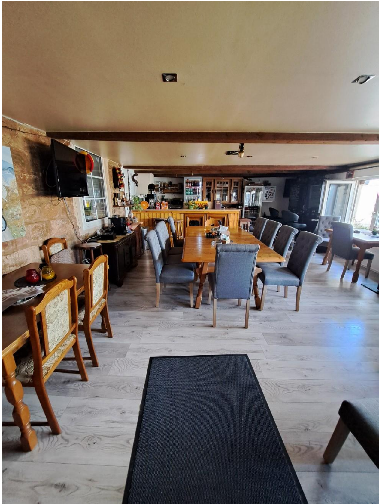
Gastro mit Nebengebäude Scheunenausbau