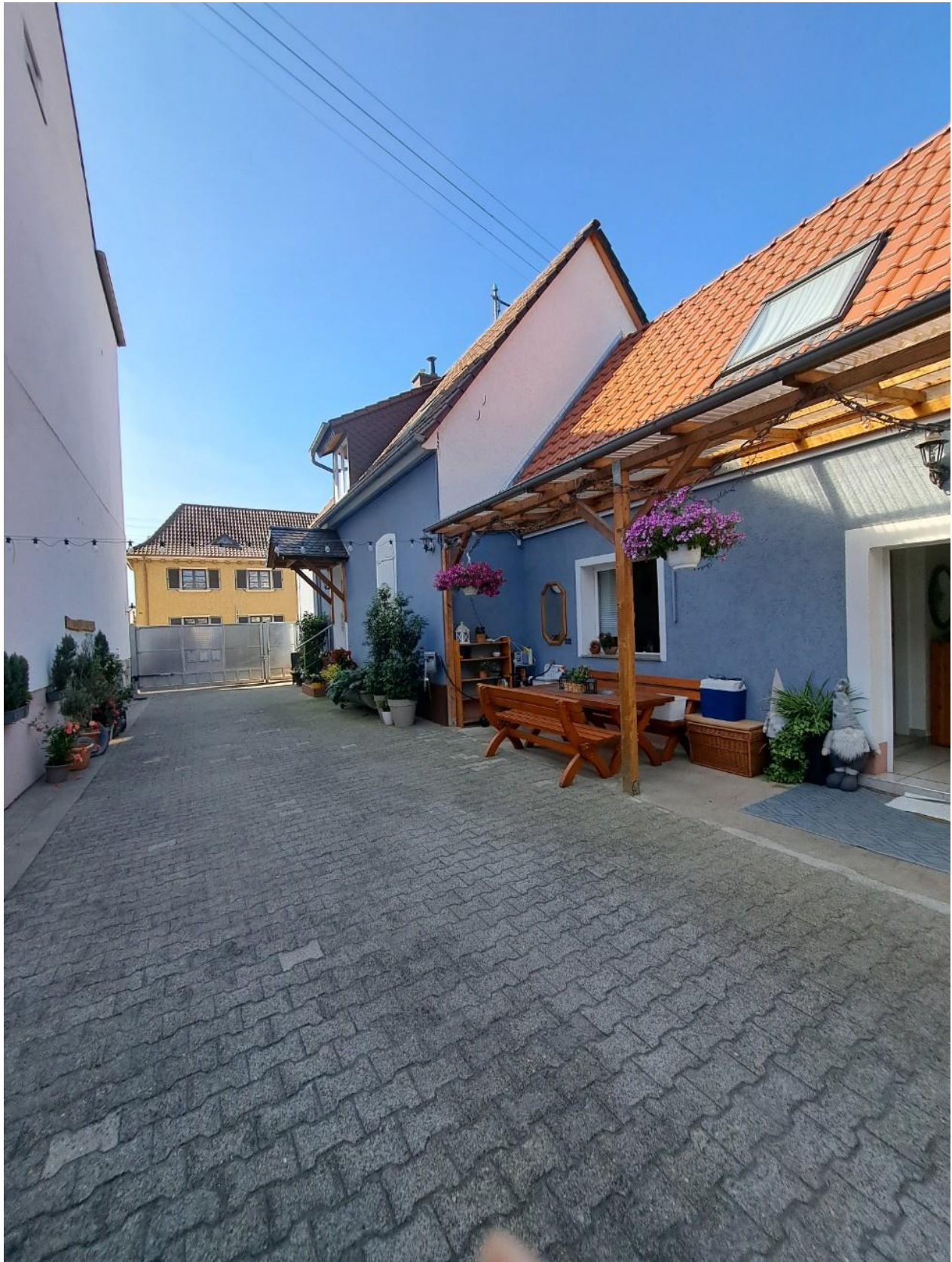
Blick Hof zur Straße