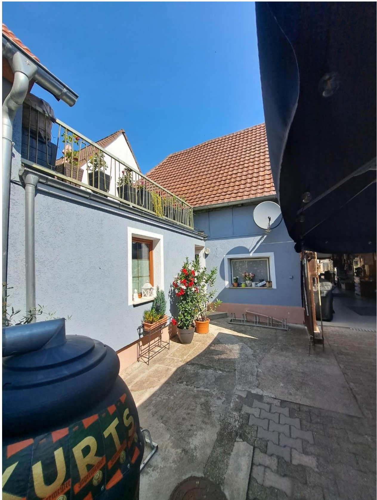
Blick in den Hof