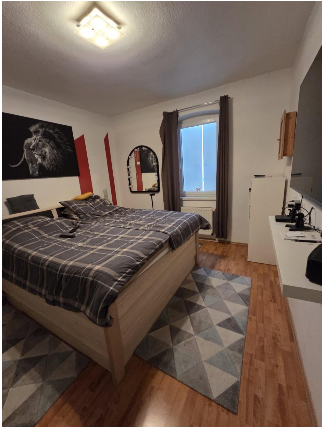
Schlafen EG vorne