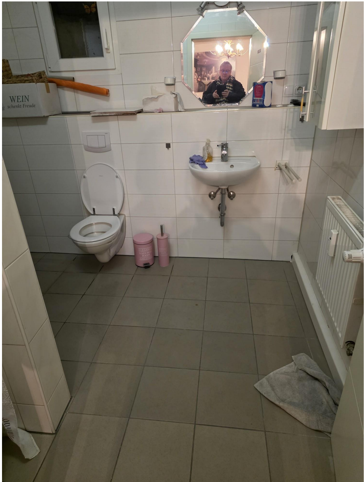
Dusche WC ausgebaut Scheune