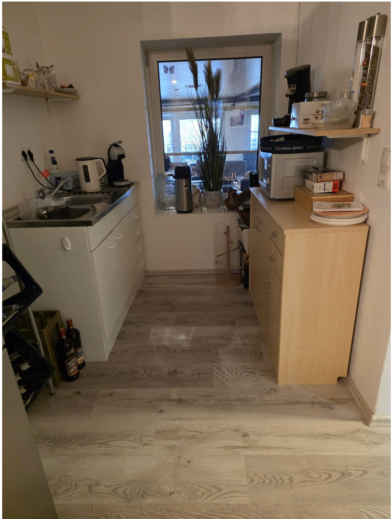
Abstellfläche ausgebaut Scheune (Gastro)