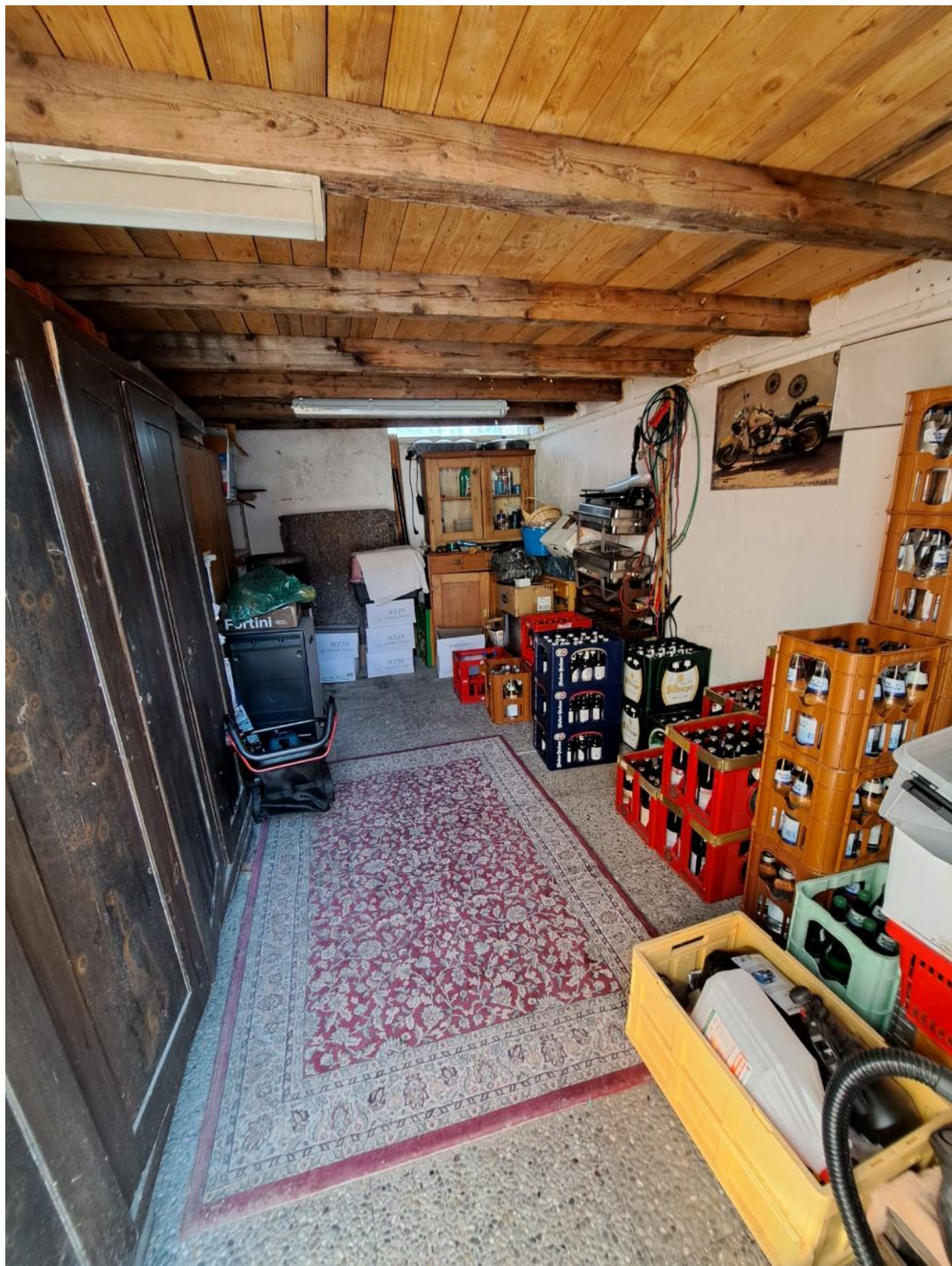
Schuppen neben dem Lager