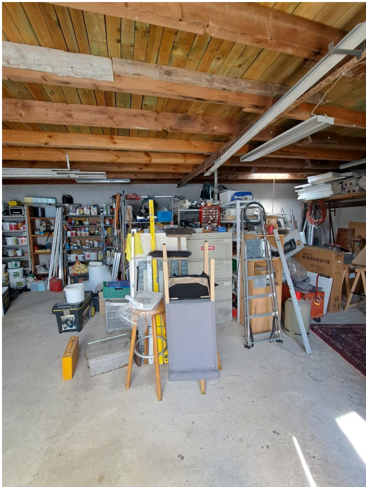
Großes Lager 70 qm