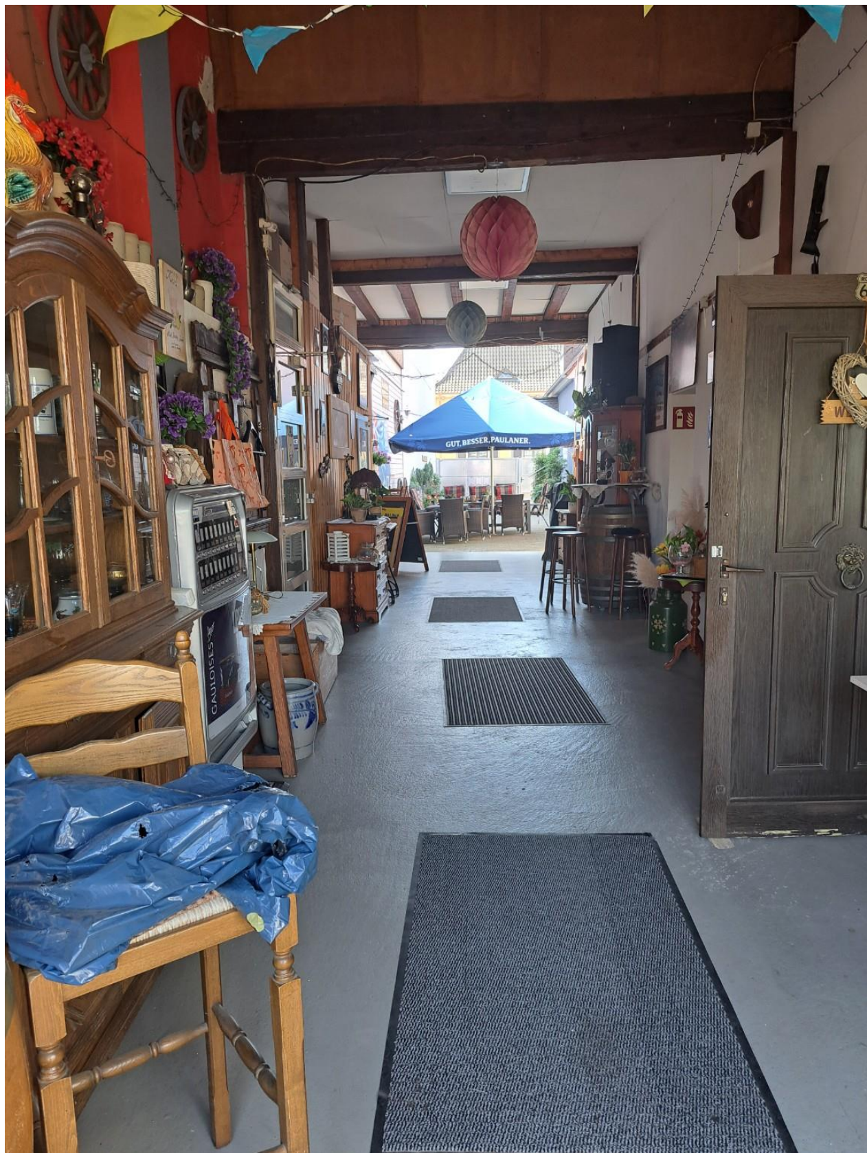
Durchgang Hof zum Garten