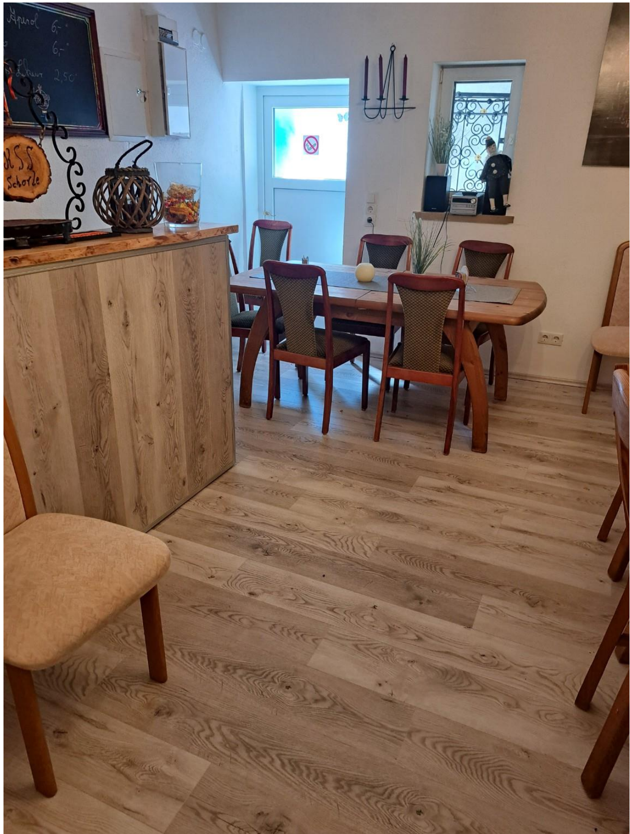
Nebenzimmer ausgebaut Scheune