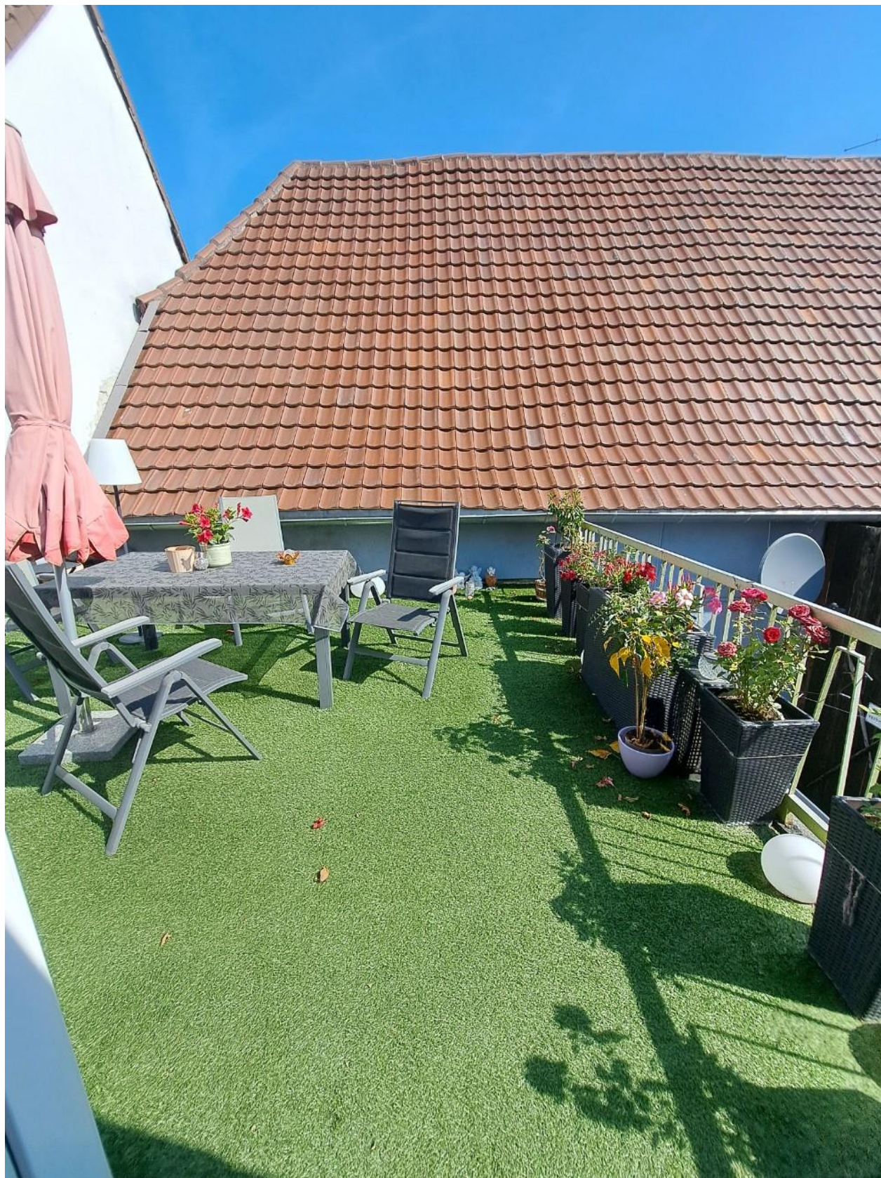
Große Terrasse OG vorne