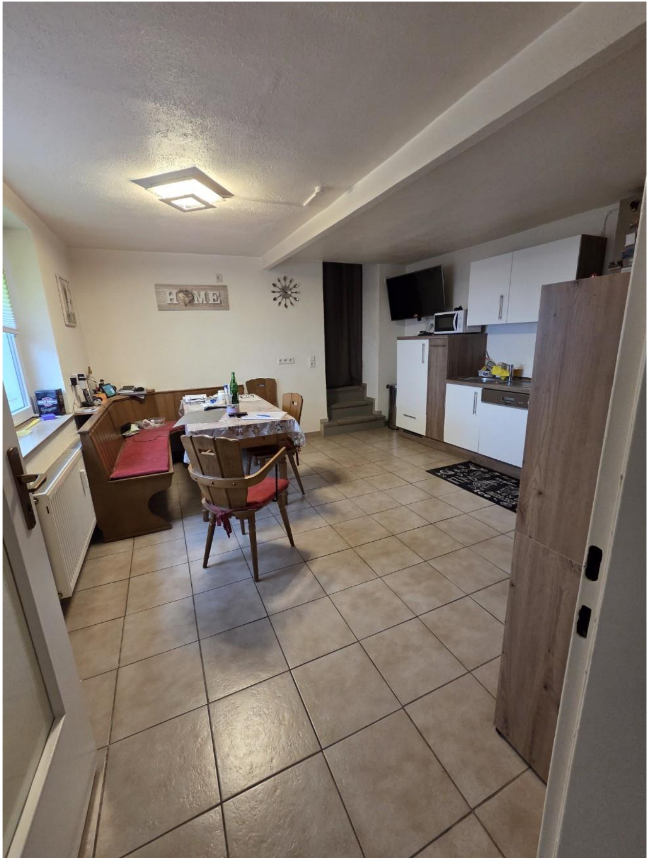
Küche EG vorne