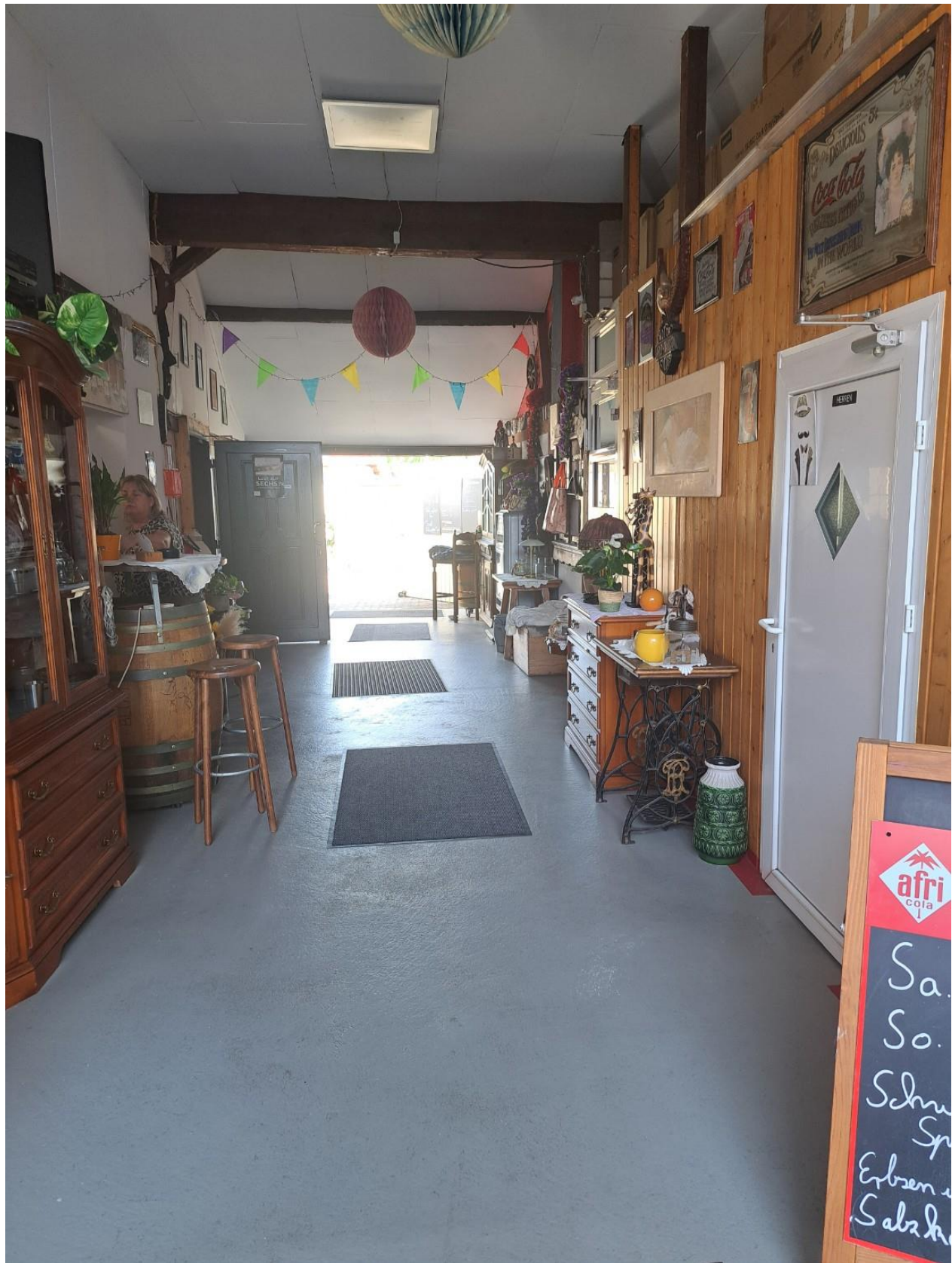
Durchgang zum Garten Damen und Herren WC