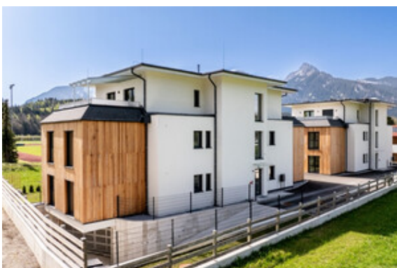
Außenansicht / Tiefgarageneinfahrt