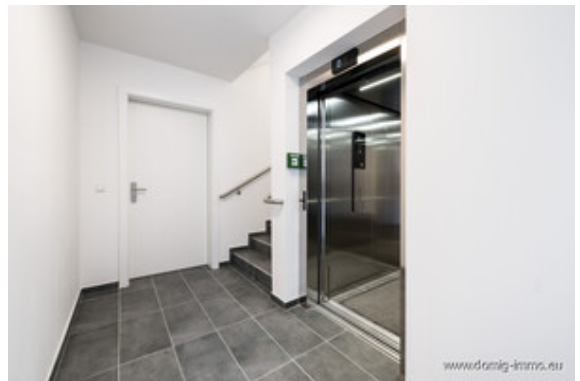
Aufzug / Stiegenhaus