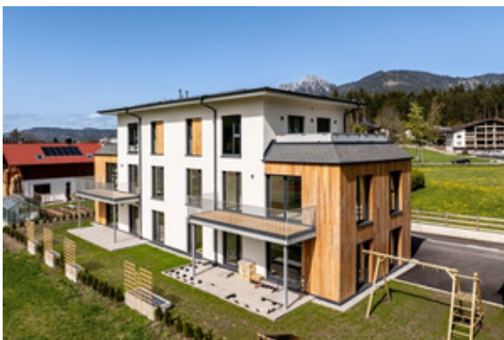
Außenansicht Haus A