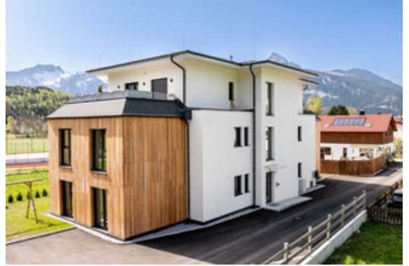
Außenansicht Haus A