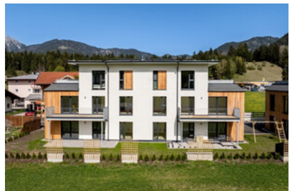
Außenansicht Haus A