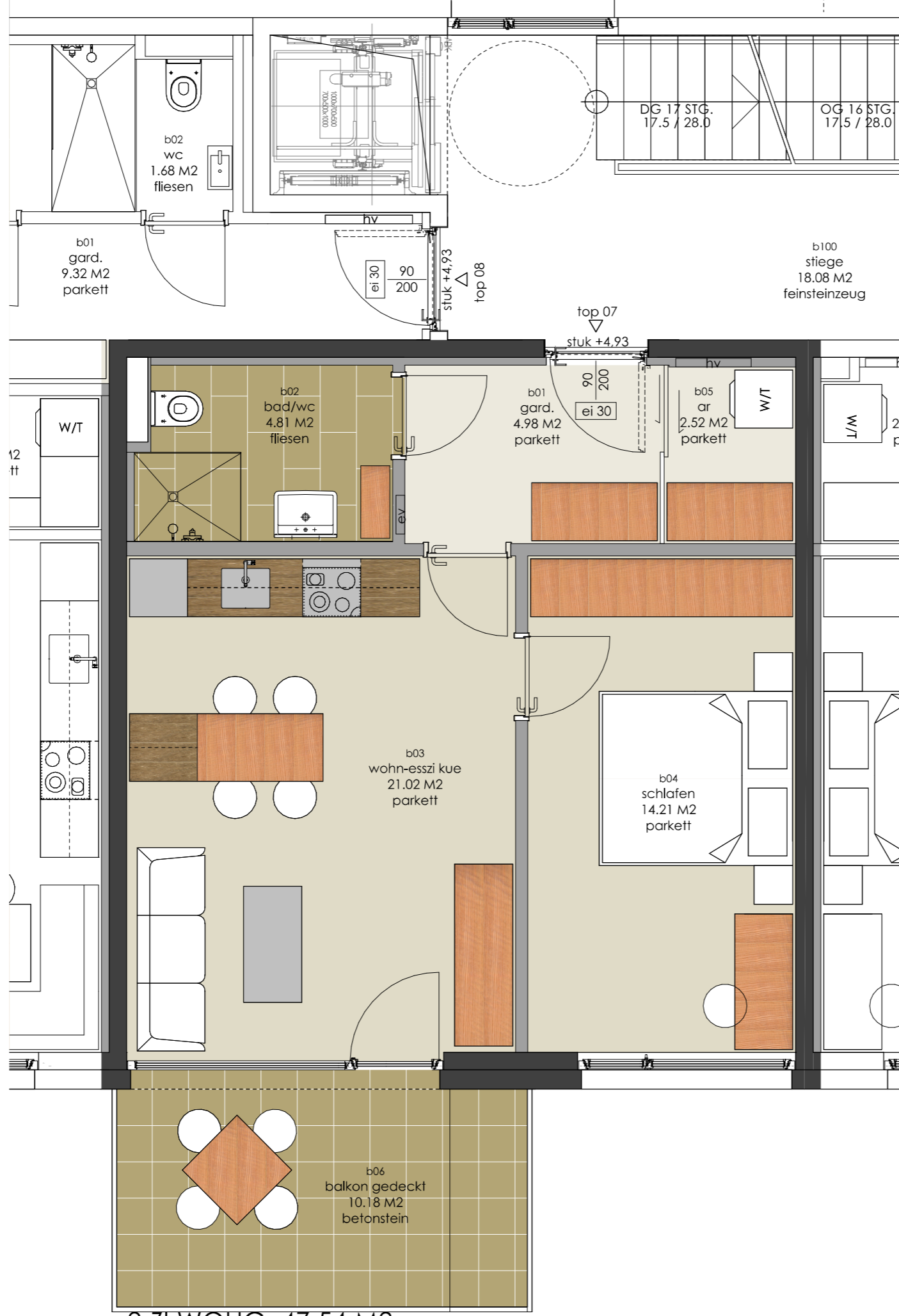
2-ZI WOHG. 47,54 M2