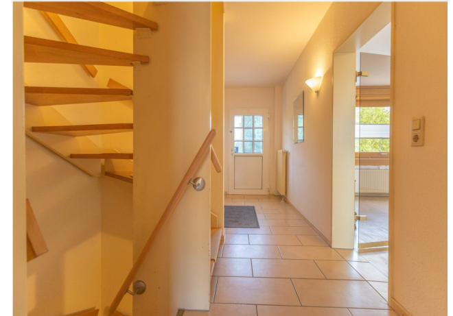
Diele im EG