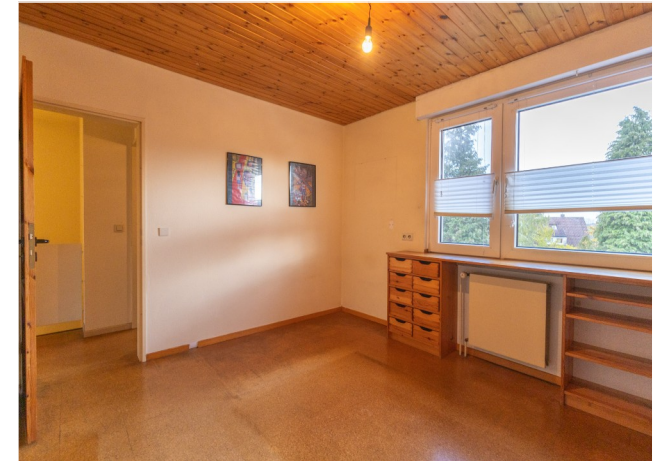
Kinderzimmer mit Einbauschränk