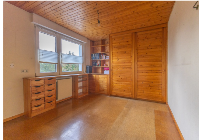
Kinderzimmer mit Einbauschränk