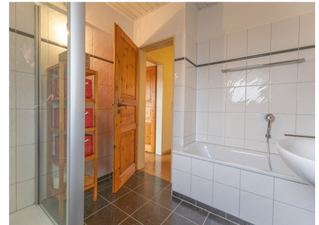
Tageslichtbad mit Badewanne und Dusche