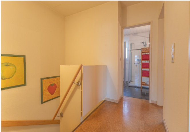
Diele im OG