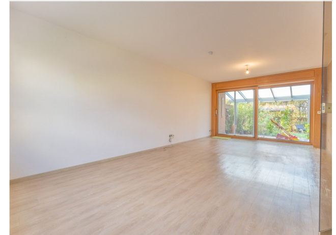
großes Wohn-Esszimmer mit Zugang zur Terrasse