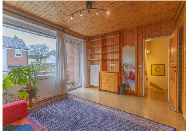
Schlafzimmer mit Zugang zum Überdachten Balkon