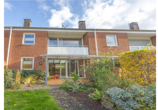
Haus & Gartenansicht