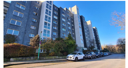
Laakmannsbusch 15 - 27