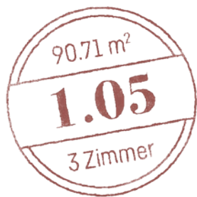
Haupthaus - Obergeschoss