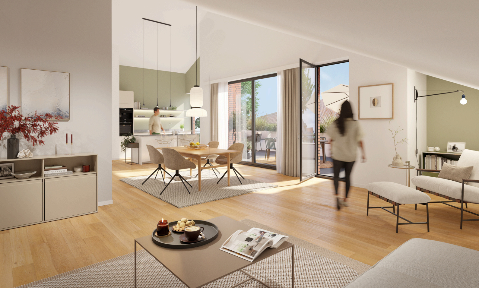
ABBILDUNG PENTHOUSE WOHNUNG. IRRTÜMER VORBEHALTEN.